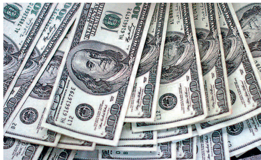
▲美國瘋狂發債、放水谷經濟的結果，是催生債務風險、資產泡沫與引發通脹急升等問題。

債的信號。不過，減少發債消息一出，市場對聯儲局快將收水疑慮隨之升溫，10年期美國國債價格應聲下跌、息票回升，華爾街股市也難逃高位回調。