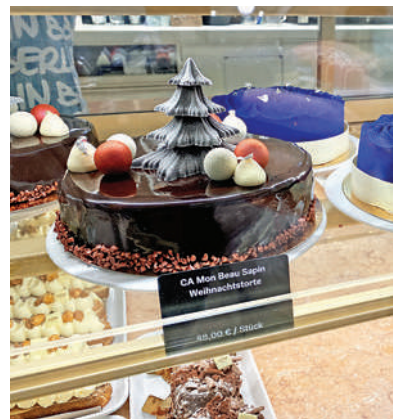
▲聖誕節的「改良版」黑森林蛋糕。

在德國，甜點最「活躍」的時期應該是一年到頭最「甜」的聖誕假期。聖誕果脯蛋糕，年輪樹樁蛋糕，還有心形的大薑餅，都是聖誕餐桌上必不可少的成員。特別是有幾家老字號生產果脯蛋糕和年輪樹樁蛋糕的點心作坊，因為產量有限總是很難「搶到」。他們早在十月底便開放預定，以便大大小小的蛋糕能在聖誕節前及時完成並且郵寄