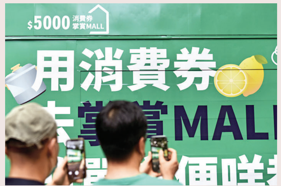
▲特區政府近日向市民發放第一期電子消費券，帶動本地消費熱潮。

母親總背地裏跟我笑話北方親人們不懂禮節，而父親也會在飯敘後偷偷跟我抱怨，辣椒是不是不如你奶奶做的味兒足？然而，每當飯敘之時，他們總會調整好自我的狀態，努力融入其中。而親人們，也會用自己獨特的關懷，給予不同地區最大的尊重。我想，這是不是就是飯敘的意義所在？圓桌之上，千人千色。然而，在這難得的聚合中，人們都會收斂自我的鋒芒，終究為着一份相逢的「情」字。不論是南方飯敘中的虔誠以待，還是北方飯敘中的熱情寒暄，抑或半南半北飯敘的互相諒解，千年以來，這飯敘文化承載的，就是中國人心中對團圓、和睦的嚮往。正如那圓桌，圓潤光滑、毫無棱角。它托起的，就是那份體己的、飄着香氣的人情。