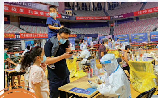
▲南京五台山核酸檢測點。