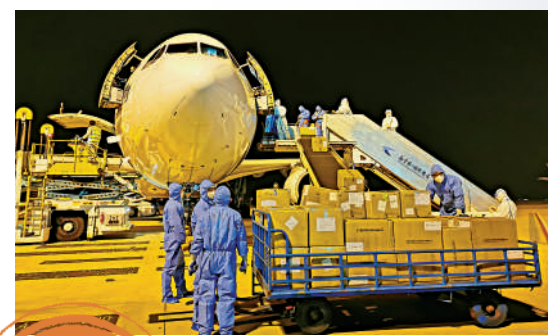
▲今年七月，以南京祿口機場為源頭，內地出現新一輪聚集性疫情。資料圖片

問責原由： 令行禁止，政令暢通，對於確保疫情防控效果至關重要。相反，如果令不行、禁不止，對於上級指令充耳不聞，甚至「上有政策 下有對策」，無疑將遭到問責與懲處。