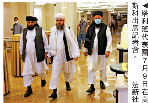
▲塔利班代表團7月9日在莫斯科出席記者會。

俄羅斯頻頻呼籲在歐亞經濟聯盟或集體安全條約組織（CSTO）的框架下舉行和談，並以CSTO成員國的身份加強與中亞國家的軍事合作。此前不久，塔利班在阿富汗的進攻迫使數百名阿富汗士兵越過邊境逃往塔吉克斯坦，杜尚別隨後向莫斯科求援，以保證其邊境安全。俄羅斯本月5日起，與塔吉克斯坦及烏茲別克斯坦兩國，在與阿富汗接壤地區發起聯合軍事演習，目標是要確保邊境的控制。