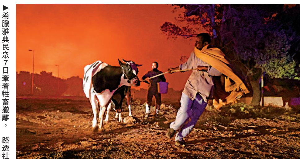
▲希臘雅典民眾7日牽着牲畜撤離。

美國加州的「迪克西山火」亦持續蔓延，晉升為當地史上最大規模山火。這場大火已燒毀逾1700平方公里的土地，造成3名消防員受傷，4人失蹤，目前僅有21%的火勢受到控制。當局還表示，預料陣風會助長火勢，加上陡峭地形和大量乾燥植被，令消防員的工作更加困難。