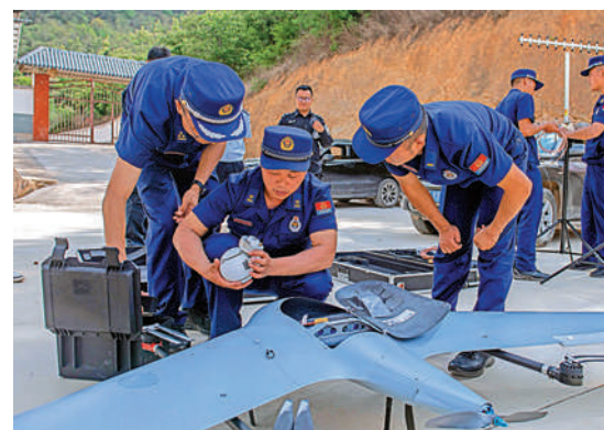
▲工作人員組裝用以檢測象群行蹤的無人機。

衡的角度開展有預見性的、長期的總體布局與規劃。就現階段而言，構建完善的監測防範體系，運用合適的技術手段對亞洲象活動進行有效管控，盡可能避免亞洲象大規模遷移擴散至關重要。象群回歸後，各地關於亞洲象安全防範和應急處置的工作機制已經形成，「即使象群北移事件再度發生，相信我們也能夠從容應對」，沈慶仲說。