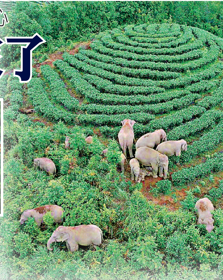
▲截至8月6日19時，象群持續在雲南省玉溪市元江縣小干壩村正北方向670米處的林地內活動。

8月8日20時許，北移亞洲象群經人工引導，通過老213國道元江橋（距元江縣城7公里）跨越元江幹流，抵達元江南岸。北移亞洲象群安全防範工作省級指揮部指揮長，雲南省林業和草原局黨組書記、局長萬勇表示，15頭亞洲象全部安全返，象群總體情況平穩，沿途未造成人、象傷亡，雲南北移亞洲象群安全防範和應急處置工作取得決定性進展。這次亞洲象群遷移，也成為了一次科學之旅、探索之旅、保護之旅。