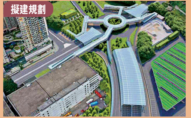
▲▲龍躍頭交匯處（左圖），現場所見仍是十字路口，右圖為政府目標於2024年至2031年分階段完成基礎設施工程規劃圖。