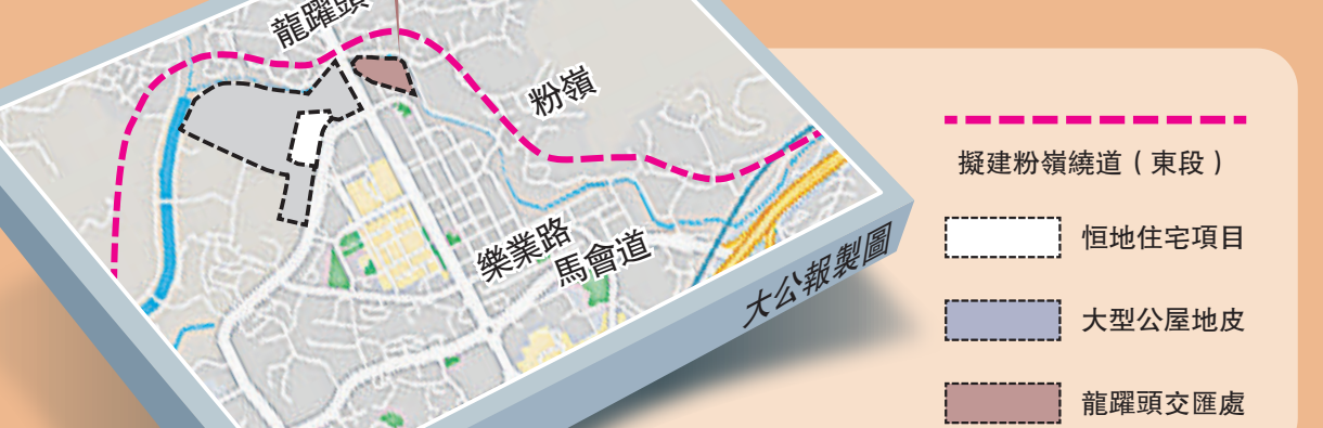
新界東北新發展區規劃圖