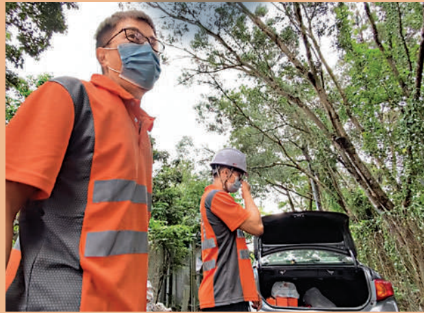
▲一名外判工人指數月前開始為港鐵古洞站進行前期探土工作，相反政府的工程則進行得較慢。