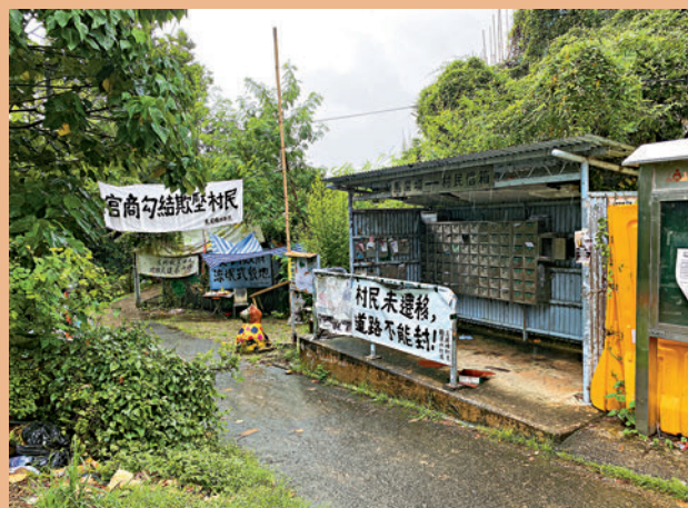
▲馬適路馬屎埔村是規劃幹道的一部分，目前仍是村民出入的行人路，未有任何開關或施工跡象。