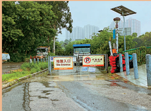
▲梧桐河以北的幹道建造及改善工程，該範圍大致已封路，開門貼有「地盤入口」字句。