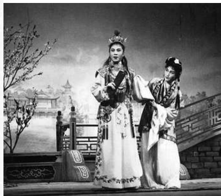
▲一九六一年徐玉蘭（飾賈寶玉，左）、王文娟（飾林黛玉）在港演出《紅樓夢》劇照。圖為經典唱段《紅樓夢·讀西廂》。