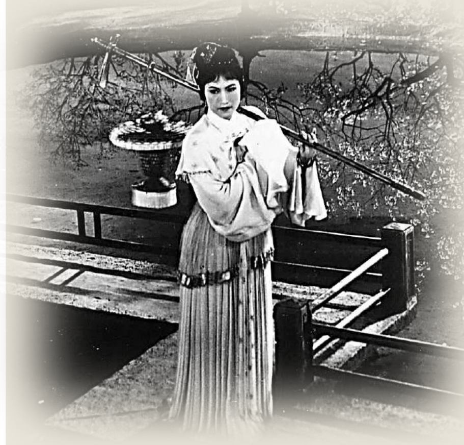
▲王文娟演繹《紅樓夢·葬花》。