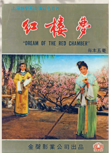
▲《紅樓夢》電影特刊，影片當年在港放映連續一個月。