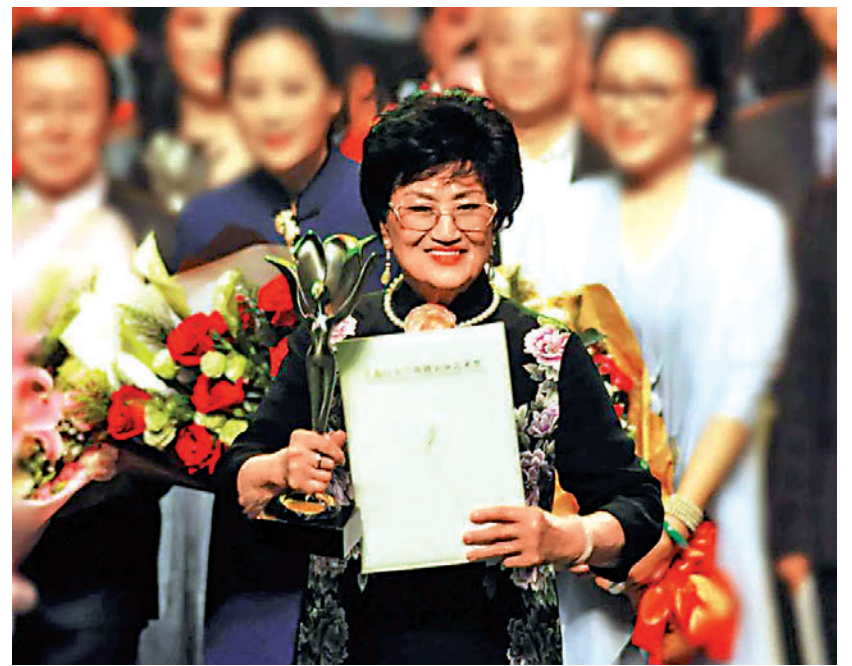
▲二〇一七年四月，九十一歲的王文娟獲得第二十七屆上海白玉蘭戲劇表演藝術獎「終身成就獎」。

生徐玉蘭的貢獻可說是最令人刮目相看的。一九六一年，上海越劇團首次來港，在九龍普慶戲院演出，演員有袁雪芬、徐玉蘭、王文娟、呂瑞英、金采鳳等，劇目有《西廂記》、《紅樓夢》、《打金枝》、《碧玉簪》等，演出備受歡迎，但其中，由徐、王主演的《紅樓夢》，觀眾搶購門票達到了狂熱的程度，場場爆滿，一票難求，而且，每當演到「黛玉焚稿」和「寶玉哭靈」時，場內必然泣聲四起，不少女士「喊濕幾條手巾仔」，完全被王文娟和徐玉蘭真情流露的演出打動了，演畢謝幕多次觀眾還不肯離去，場面十分感人。