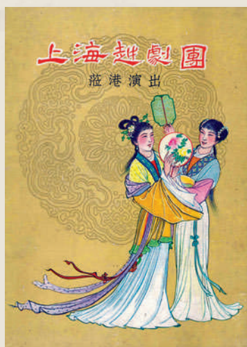
▲一九六一年上海越劇團訪港演出特刊。