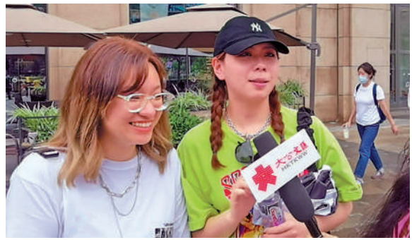
記者在北京街頭採訪00後，發現「黑話」更多用在發微博、看視頻節目發彈幕或追星時。大公報記者朱燁報導

不少學者和媒體認為，00後社交「黑話」的形成源自對書面語和口語的改寫、縮寫及對網絡語言的模仿、攫取和接收，並在他們日常生活的創造、使用和傳播中成為自我表達、情感宣洩、身份建構以及尋求認同的重要工具。對此無需大驚小怪，這種文化現象或許會隨着年齡增長、興趣變化而逐漸消失，只需關注其價值取向、警惕低俗污穢即可。