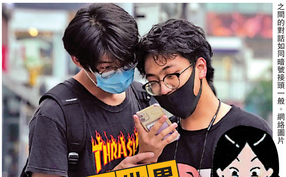
00後溝通採用摩斯密碼一般的縮寫，讓彼此之間的對話如同暗號接頭一般。

00後「黑話」最早緣於追星一族的「飯圈」，為避免討論娛樂時不小心涉及敏感詞彙，被社交媒體屏蔽，同時也為避免黑粉惡意中傷自己的偶像，所以粉絲圈幾乎都會用縮寫代替偶像名字，多出現在提及流量明星時，比如吳亦凡（wyf），楊超越（ycy）等。後又衍生出多個詞彙，比如「走花路」（祝偶像前程似錦、前途光明）、「糊了」（不火了）等。