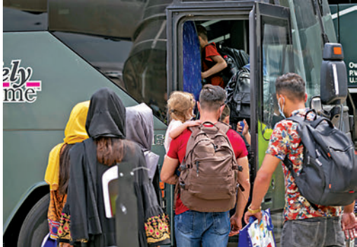
▶一批阿富汗難民14日抵達加拿大。

塔利班攻勢未停，周六繼續向首都喀布爾推進。美聯社報道，塔利班已抵達距離喀布爾南部僅11公里的地區，與政府軍展開激戰。截至周六晚，塔利班已經攻佔了阿富汗全國34省的19省省會，包括第二大城市、南部經濟重鎮坎大哈和第三大城市、西部重鎮赫拉特。