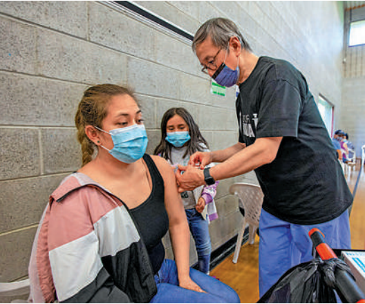
▲民眾5月在加拿大多倫多接種新冠疫苗。

加拿大政府間事務部長勒布朗強調，接種疫苗是結束大流行、幫助全面重開經濟的最好辦法，希望聯邦公務員遵守這一強制性要求。對於無法接種疫苗的少數公務員，可視情況採取通融或替代措施，例如檢測。據悉，加拿大有超過30萬名聯邦公職人員，依據聯邦勞動法僱用的國有和全國性行業從業人員更多。