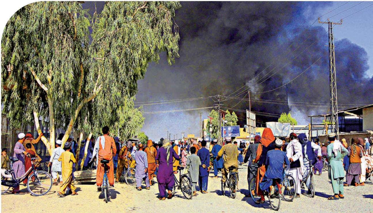
▲阿政府軍和塔利班12日在坎大哈交戰，空中濃煙滾滾。