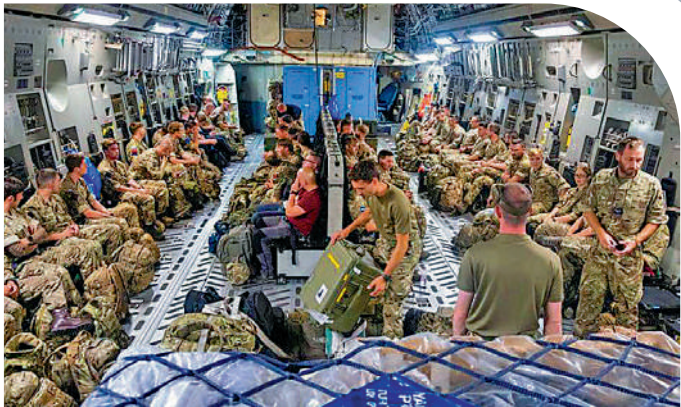
▲英國13日派士兵前往阿富汗接回外交人員。