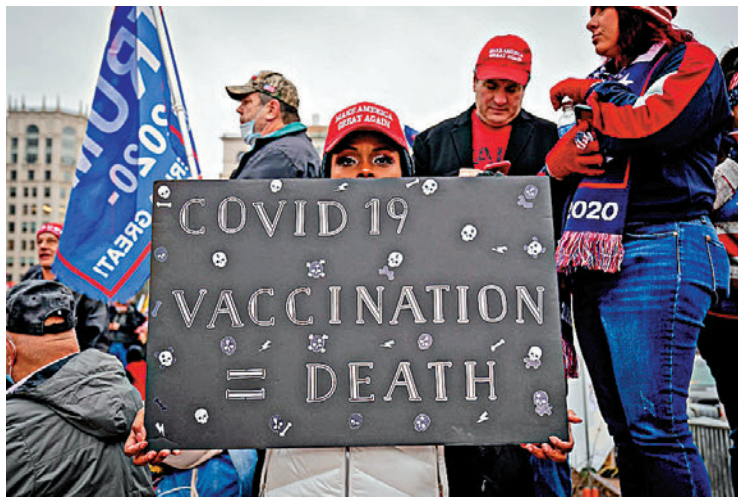
▲1月5日，一名特朗普的支持者在華盛頓參加反疫苗示威。

【大公報訊】綜合《紐約時報》、《華盛頓郵報》、CNN報道：美國政府在疫情防控、政策實施、溯源調查等多方面反科學反常識，前總統特朗普頻繁通過白宮疫情簡報會等官方渠道散布反智主義的抗疫假信息，堪稱「新冠假信息的最大推手」；再加上Facebook、推特等社交媒體上反疫苗等假新聞氾濫，導致大批民眾聽信謠言、受到誤導。近日隨着Delta變種病毒肆虐，其中7月網上有關「疫苗不起作用」的信息相較6月暴增437%；而8月全美新增的150萬宗確診病例中，絕大多數人都沒有打針。