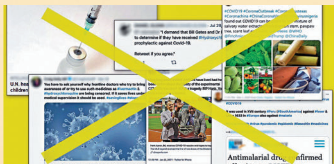
▲社交網站上充斥着新冠謠言。