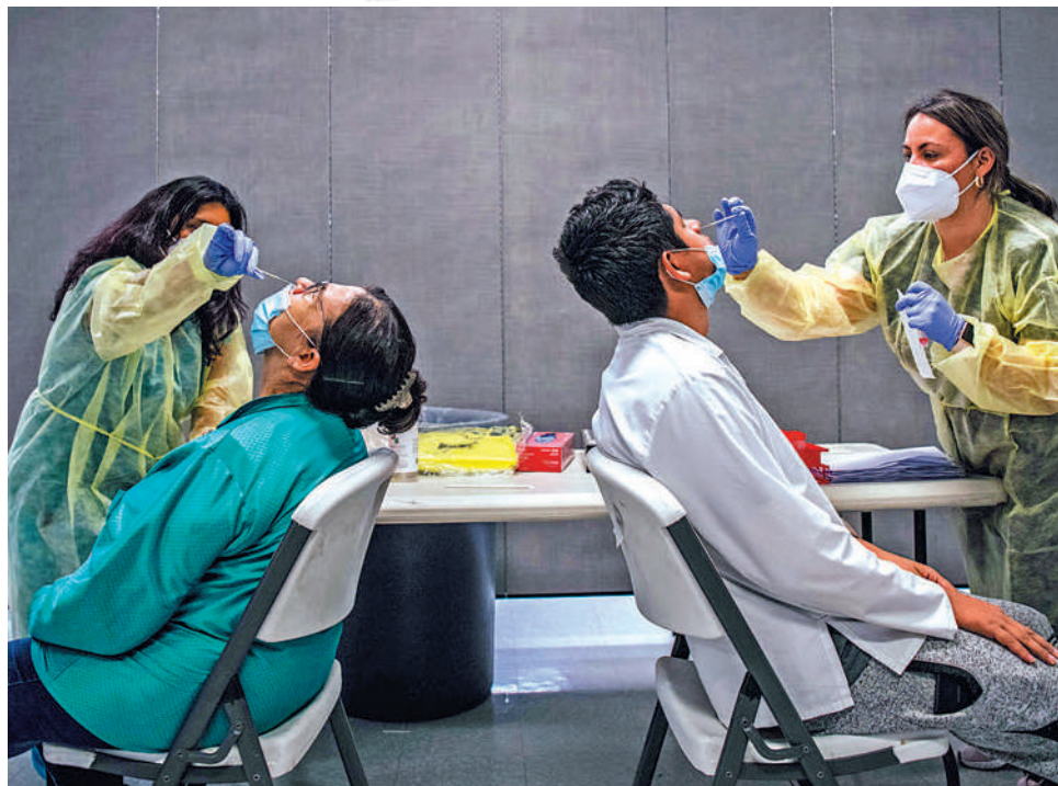
▲德州休斯敦醫護13日為民眾做病毒檢測。

去年疫情初期，特朗普便聲稱新冠肺炎「流感」，病毒將隨着天氣變暖「自然消失」，極力淡化疫情風險。去年3月，美國每日新增確診人數開始快速增長，特朗普又轉而開始推廣抗瘧疾藥物經氣味為「抗新冠神藥」，而美國食品及藥品管理局（FDA）明確警告服用經氣味可能產生嚴重副作用。特朗普還在檢測問題上混淆視聽，聲稱檢測太多才導致美國病例激增，更揚言要「放緩檢測」。