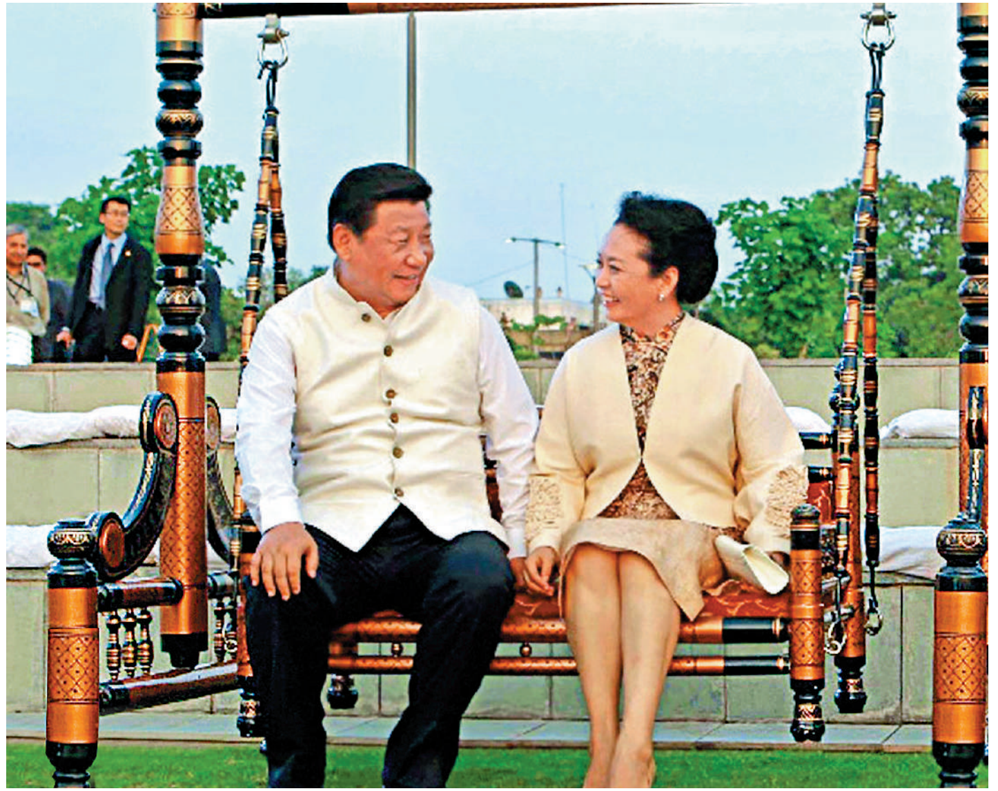
▲2014年9月17日，中國國家主席習近平抵達古吉拉特邦艾哈邁達巴德市，開始對印度進行國事訪問。圖為習近平和夫人彭麗媛在印度總理莫迪陪同下一起蕩鞦韆。