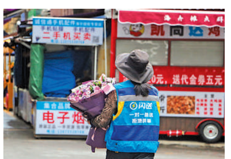
▲8月14日，安徽合肥一花市店門口，一位外賣快遞員懷抱鮮花。

而除了訂花的方式在改變，七夕節也早已不再是年輕人的「專屬浪漫」。據餓了麼數據顯示，今年跟戀愛相關的節日中，中老年人下單的鮮花訂單同比去年增長超過3倍。