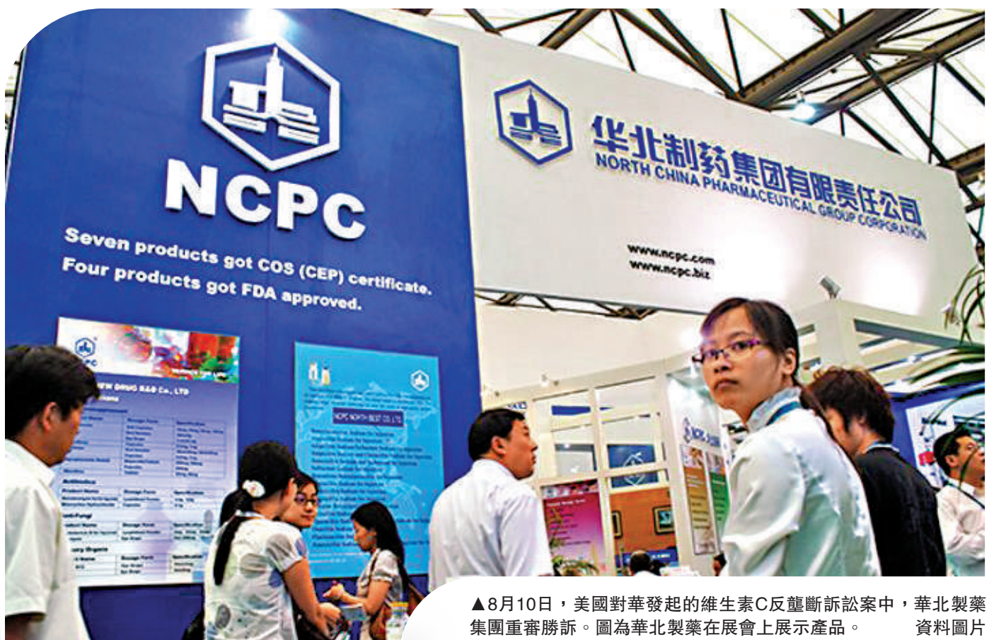
▲8月10日，美國對華發起的維生素C反壟斷訴訟案中，華北製藥集團重審勝訴。圖為華北製藥在展會上展示產品。