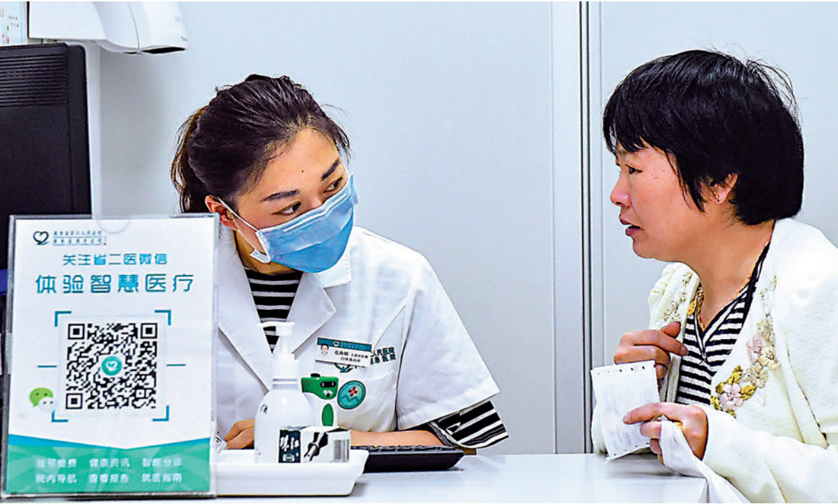
▲數碼健康生態圈在亞洲冒起，運用創新科技提升醫療服務效率和質素，是一項令人鼓舞的發展。