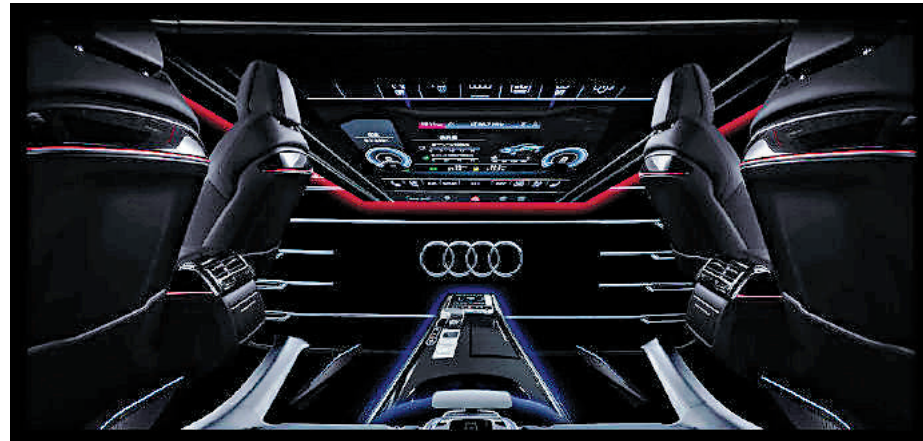
▲新奧迪A8L 60 TFSI e的NFT數字藝術作品系列「幻想高速」之一「艙體」——根據轎車的內部結構重新創作，油電混合動力在兼顧動力的同時致力環保。

再次，基於區塊鏈技術的web3.0時代，去中心化的權益掌握在每個人自己手中。當互聯網有一天成為空氣一樣的存在而不可或缺，數字資產將是標記身份的唯一屬性。作為展示和應用NFT的數字空間，「元宇宙」項目正在以一個擬真的邏輯仿造一個真實世界。正如2018年上映的電影《頭號玩家》中呈現的，在未來的某一天，NFT將微縮成一個裝備道具放在你的遊戲背包中，而在需要的時候隨時調取。