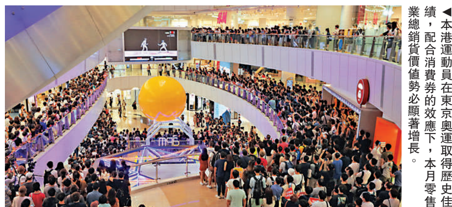
▲本港運動員在東京奧運取得歷史最佳成績，配合消費券的效應下，本月零售業總銷貨價值勢必顯著增長。

相信大家亦明白，樓市持續是需要經濟全面復甦配合，始終經濟維持增長，市民的收入才可望改善，再者今年首季住戶入息中位數已有所回升，相信隨着整體經濟逐步回穩下，整體樓市交投亦會持續活躍。