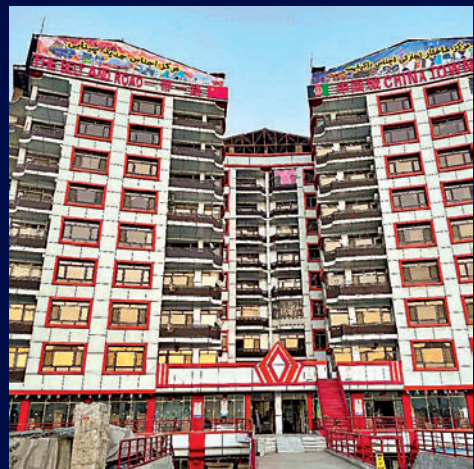
▲ 位於喀布爾的「一帶一路」中國城。