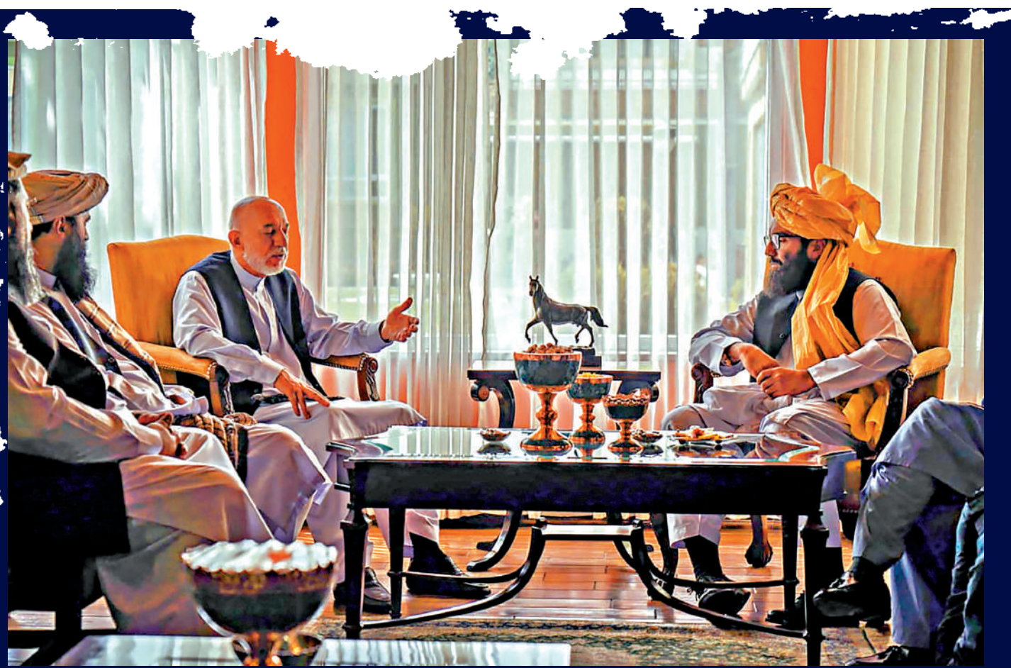
▲18日放出的照片顯示，塔利班高層阿納斯哈卡尼（右）與阿富汗前總統卡爾扎伊（左）在阿富汗會面。