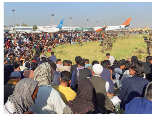
▲美軍16日在阿富汗喀布爾國際機場戒備。

英國各界就此事要求藍韜文辭職，稱這是一次「災難性的判斷失誤」。工黨黨魁施紀賢18日在英國下議院會議中，就此事面斥約翰遜和藍韜文失職。