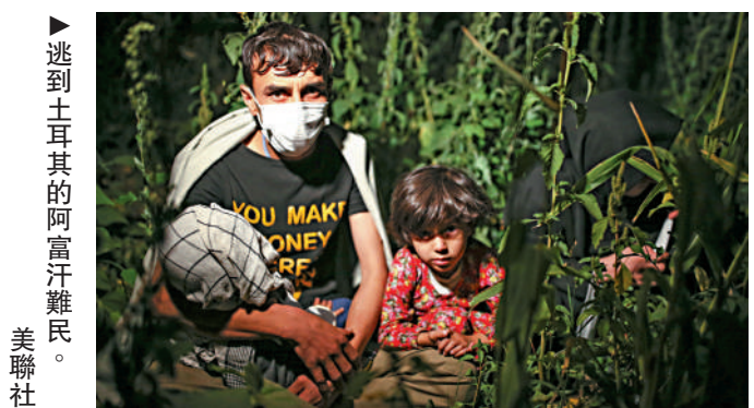
►逃到土耳其的阿富汗難民。

繼賈拉拉巴德18日爆發反塔利班示威造成3死10多人傷後，抗議浪潮19日蔓延至喀布爾，約200人參與了反塔利班遊行，隨後被暴力驅散。儘管塔利班承諾大放全體政府工作人員，但許多公務員害怕遭到報復仍躲在家中，電力、衛生設施和自來水等公共服務可能很快就會受到波及。