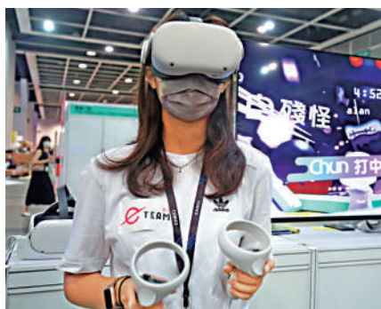
▲香港電腦通訊節今日開鑼，展商人員展示VR新產品。