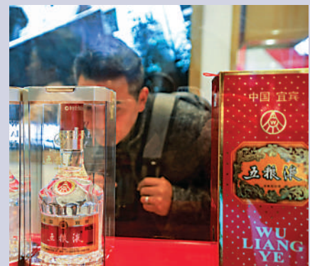
▲白酒龍頭之一的五糧液跌破近期低位。

來自銷售商的數據顯示，目前飛天茅台價格已達到3200元一瓶，較官方指導價1499元一瓶高逾1倍。白酒專家肖竹青向內媒表示，國家有關部門召開此次會議是一種提示警醒的作用，是指導性效力而不是指令性和強制性效力。他認為至少未來5年內，飛天茅台的價格仍將高位運行。