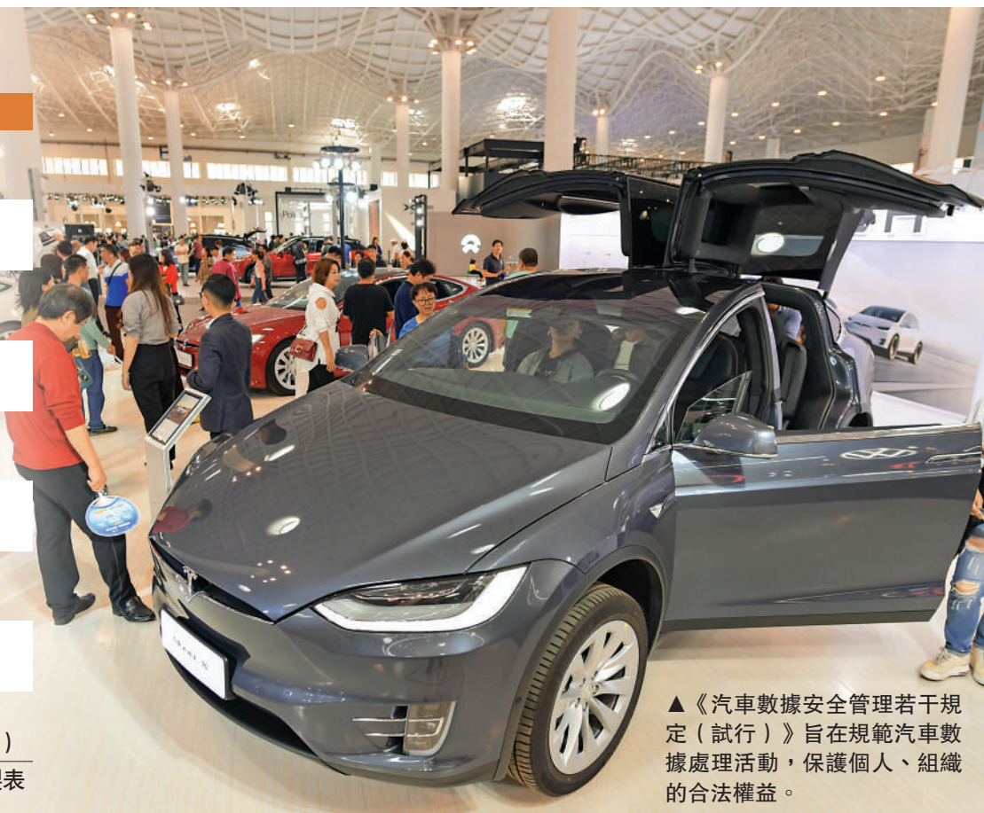
▲《汽車數據安全管理若干規定（試行）》旨在規範汽車數據處理活動，保護個人、組織的合法權益。

國家互聯網信息辦公室有關負責人表示，出台《規定》主要基於防範化解汽車數據安全風險的實踐需要、保障汽車數據依法合理有效利用的客觀需要。《規定》倡導，汽車數據處理者在開展汽車數據處理活動中堅持「車內處理」「默認不收集」「精度範圍適用」「脫敏處理」等數據處理原則，除非確有必要不向車外提供，盡可能進行匿名化、去標識化處理，減少對汽車數據的無序收集和違規濫用。汽車數據處理者具有增強行車安全的目的和充分的必要性，方可收集指紋、聲紋、人臉、心律等生物識別特徵信息。