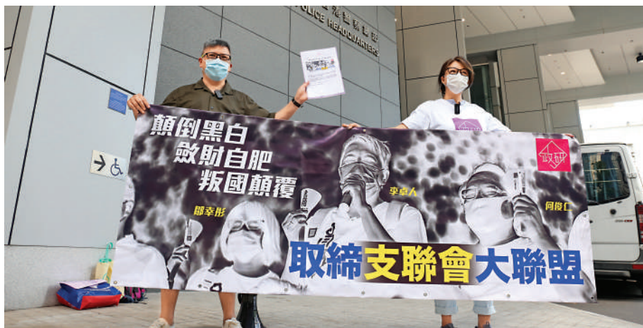
▲香港政研會要求警方國安處取締支聯會，並凍結資產。