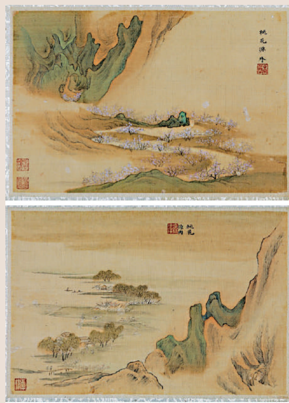
▲由上而下：高簡描繪桃花源的《寫陶潛詩意冊》（頁一及頁二）。