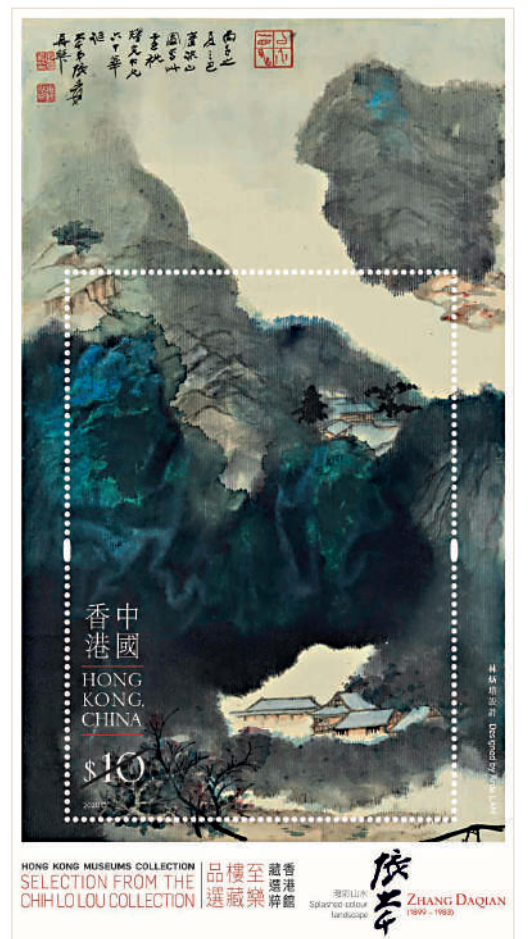
▲香港郵政去年發行「香港館藏選粹——至樂樓藏品選」特別郵票。圖為小型張展示張大千《潑彩山水》。