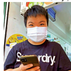
▲意外現場附近商戶有職員指當時「好驚」，聽到「嘍」一聲後好快就見到有人衝出去抬車救人。

昨日是星期日假期，有大量途人目睹意外發生一刻，紛紛驚叫，現場一片混亂，部分傷者倒臥在馬路。「有人壓嘍車底，快啲呀！」「多啲人過嚟，幫手救人呀！」有途人見到的士壓着傷者，馬上呼喚救人，並揮手示意召喚更多人過來，即時一呼百應。有人發號施令，「一、二、三」指示眾人發力，此時愈來愈多人趕至加入幫手，最後約20名途人成功將的士抬起稍稍移離，有人亦不忘提醒「唔好郁佢（傷者）」，免加劇傷者傷勢。救人片段瞬間在網上瘋傳，市民留言大讚救人壯士為「英雄」。