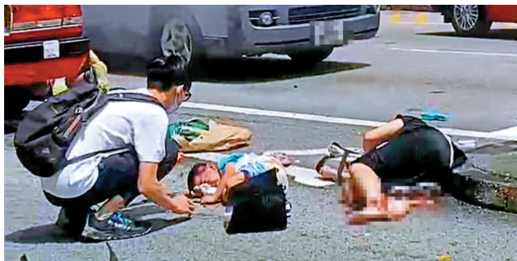
▲路過的學生走上前安慰傷者。