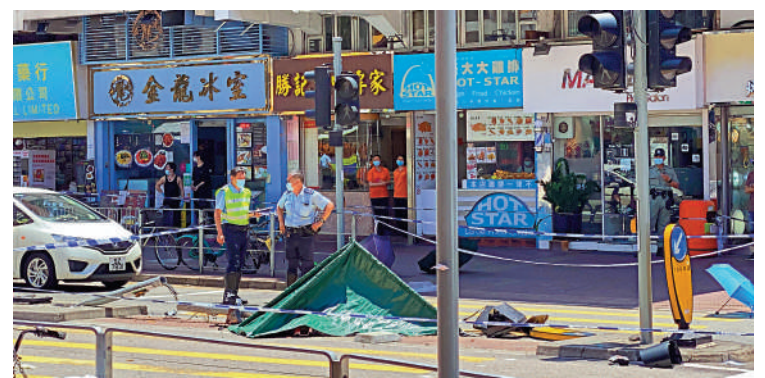
▲警方封鎖案發現場調查，並以帳篷蓋着死者。