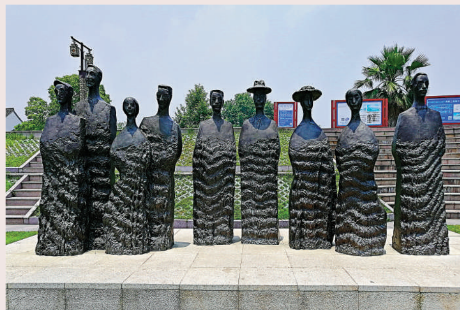
雕塑《那一天——觀潮之約》。

魚鱗狀的古海塘上寬敞平坦，有幾處人文景觀，足以打發時間。最顯眼的是約四十米高的占鰲塔，塔身六邊形，尖頂翹角，磚木結構，建於明代中期，古人視潮洶湧氾濫，毀堤淹田，故建塔於此冀望免災，成為鹽官乃至海寧的標誌性建築。石階下面一對鐵牛面朝天，傳說在清代原有多座，這一對是後補之物，作用與占鰲塔如出一轍，鎮江安瀾。看來，江水給人類帶來灌溉、航運和觀景之便，也裹挾着大小洪災，給人造成威脅，在對自然現象還不能完全解釋的古代，建塔鑄牛，企望「海寧」，委實心安。