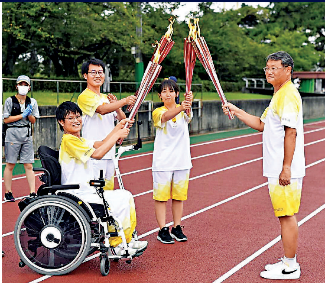
東京殘奧為期十三天。