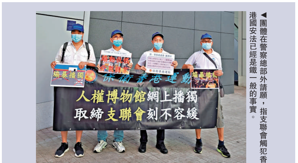
團體在警察總部外請願，指支聯會觸犯香港國安法已經是鐵一般的事實。