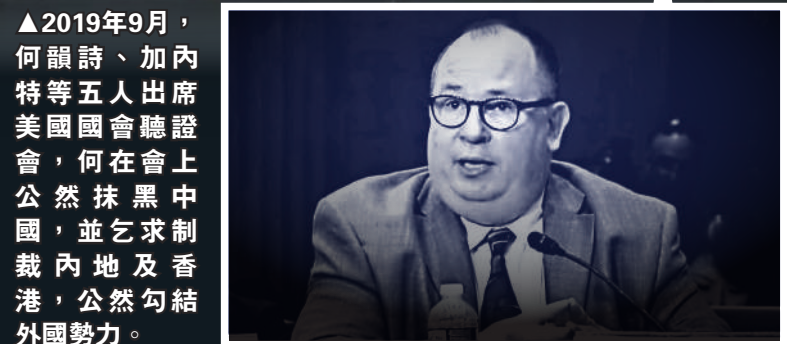
加內特是一名美國特工，曾在NSA及DIA先後任高級情報分析員、網絡情報分析員、國防情報局戰略和技術威脅分部首席分析員等職務。

五角大樓。其後加內特來港報讀城市大學，2014年爆發違法「佔中」，加內特以城大學生身份活躍於「佔中」前的相關活動，包括曾於2014年9月出席由陳方安生創辦、黎智英資助的「香港2020」舉行的政改討論會議，加內特聲稱華盛