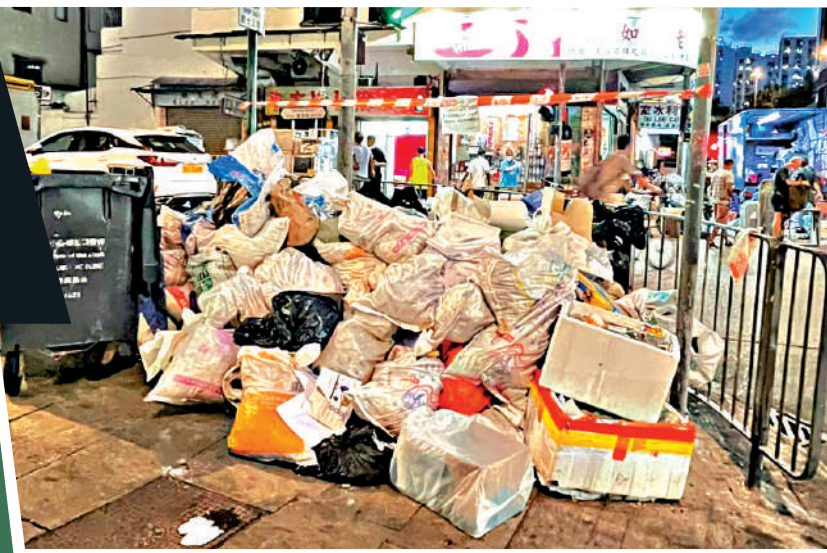
大公報記者多區實地觀察，發現「三無大廈」住戶亂掉垃圾出街，街上垃圾桶塞滿垃圾。