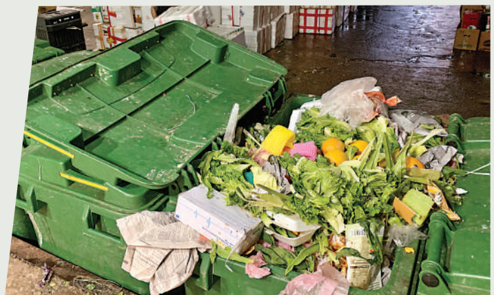
但每日全港工商及家居廚餘則超三千噸。