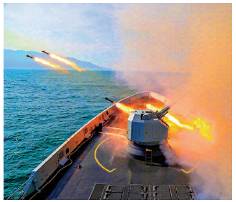
▲日前，解放軍海軍某驅逐艦支隊組織實戰化演練。

連有可能引發台海局勢的重大變化，所以此次演習有非常強的指向性。並且解放軍兵力已到達台灣東部進行演習，很多演訓活動都是帶著實彈出發，轉為實戰是說轉就轉。