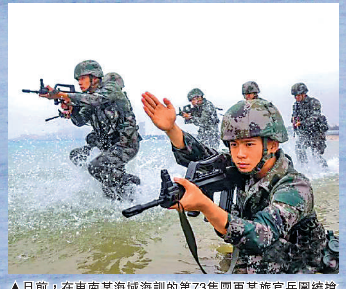
▲日前，在東南某海域海訓的第73集團軍某旅官兵圍繞灘登陸展開演練。