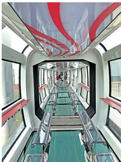
▲270度全透明的設計可讓窗外和腳下的風景一覽無餘。

同時，第三代列車車長10米，長於之前的車型，載客量提高了約30%。與常見的軌道交通形式不同，