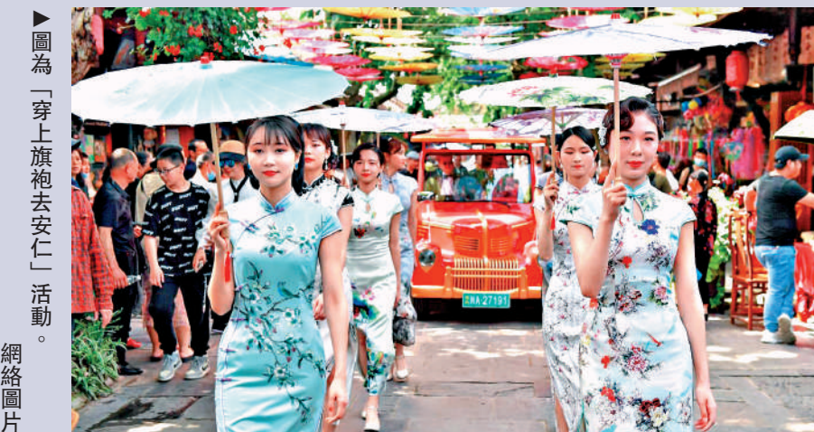
圖為「穿上旗袍去安仁」活動。

還有以「為了和平，收藏戰爭；為了未來，收藏教訓；為了安寧，收藏災難；為了傳承，收藏民俗」為主題的建川博物館，現已建成開放抗戰、民俗等30餘座主題場館，是目前國內民間資本投入最多、收藏內容最豐富的民間博物館。1000萬餘件藏品中有4000餘件國家珍貴文物和400餘件一級文件，其中1945年8月15日日本宣布無條件投降時的《大公報》就是博物館中的國家一級文物。