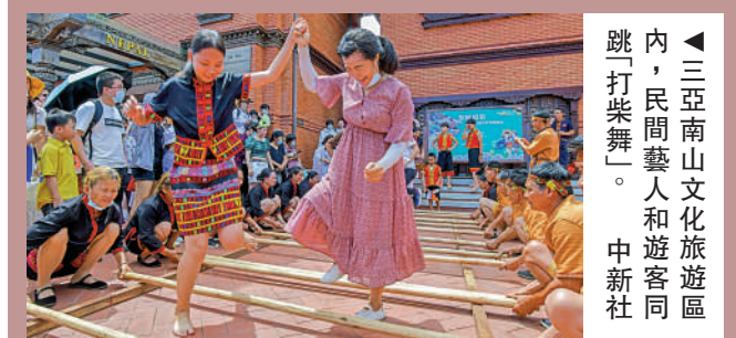
▲三亞南山文化旅游區內，民間藝人和遊客同跳「打柴舞」。