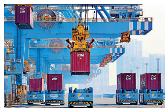
▲位於山東自貿區內的青島港全自動化碼頭，自動導引車快速進行裝運貨物。

擴展到自貿區內，審批權限下放給省級政府。此舉有利於擴大出口，也有助於我們吸引外資，發展綠色製造。