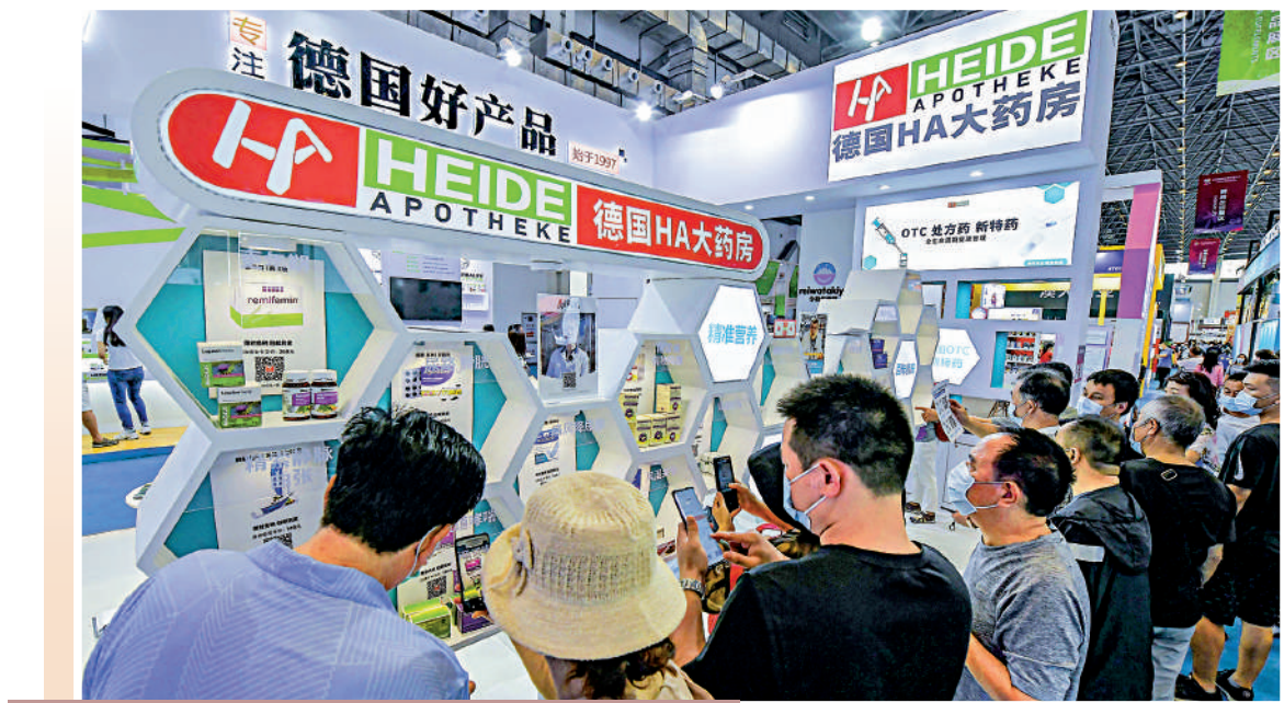
▲今年5月在海南省海口市舉辦的首屆中國國際消費品博覽會上，健康醫療養生商品受捧。圖為德國HA大藥房展位吸引民眾。