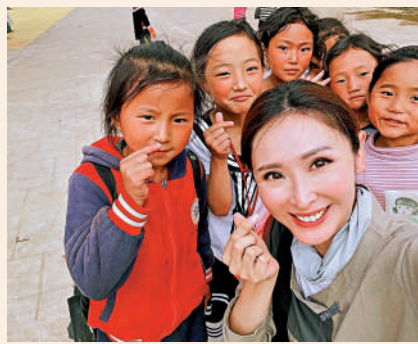
▲陳貝兒（前）到訪四川大涼山村民新居，與小朋友合攝。