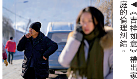
▲《吉祥如意》帶出家庭的倫理糾結。