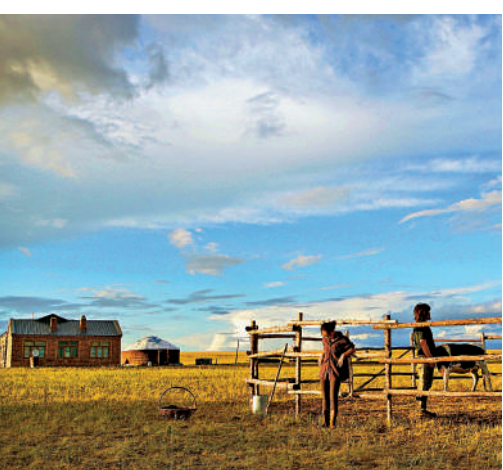
▲《白雲之下》大部分外景在內蒙古草原取景。

中國內地電影展2021 日期：9月17日至10月29日 門票：60元 訂票：城市售票網 (www.urbtix.hk)