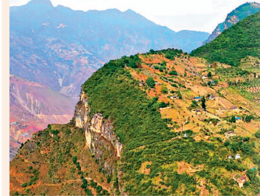
▲俯瞰四川涼山彝族自治州，位於大涼山橫斷山脈的「懸崖村」。