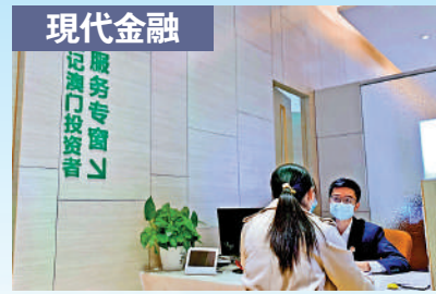
3 豐富「一國兩制」實踐的新示範