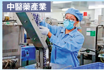
1 促進澳門經濟適度多元發展的新平台