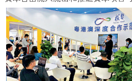
▲第九屆金交會上，橫琴自貿片區金融展位吸引了眾多參展商參觀問詢。

總體方案提出，加強合作區金融市場與澳門、香港離岸金融市場的聯動，探索構建電子圍網系統，推動合作區金融市場率先高度開放。按照國家統籌規劃、服務實體、風險可控、分步推進原則，在合作區內探索跨境資本自由流入流出和推進資本項目可兌換。