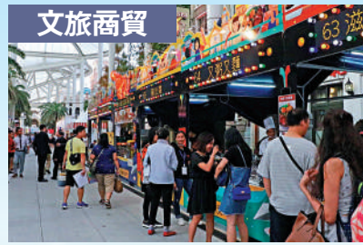
2 便利澳門居民生活就業的新空間