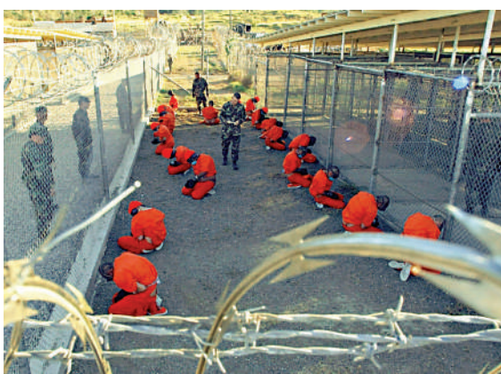
▲位於古巴的美軍關塔那摩灣監獄。

自2002年第一批共20名囚犯被送至關塔那摩以來，這座監獄大約共關押過780名囚犯，目前還有39人仍被囚於此。美媒分析指，美國總統拜登原本計劃在任內關閉關塔那摩灣監獄，但隨着塔利班重新執掌阿富汗政權，拜登在處理關塔那摩問題時可能會更謹慎、表現更強硬。