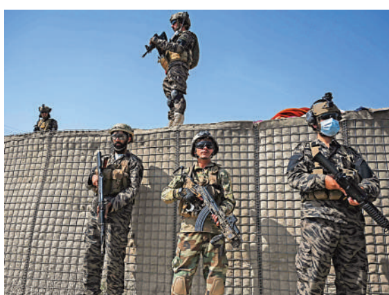
▲塔利班「巴爾迪313」軍隊成員6日站在喀布爾前中央情報局（CIA）基地附近。

富汗的飛機，先到迪拜的世衛倉庫，協助運載醫療物資，更多次警告阿富汗的醫療物資，可能在幾日內用完。巴基斯坦隨後答應協助，安排多架班機運送醫療物資。