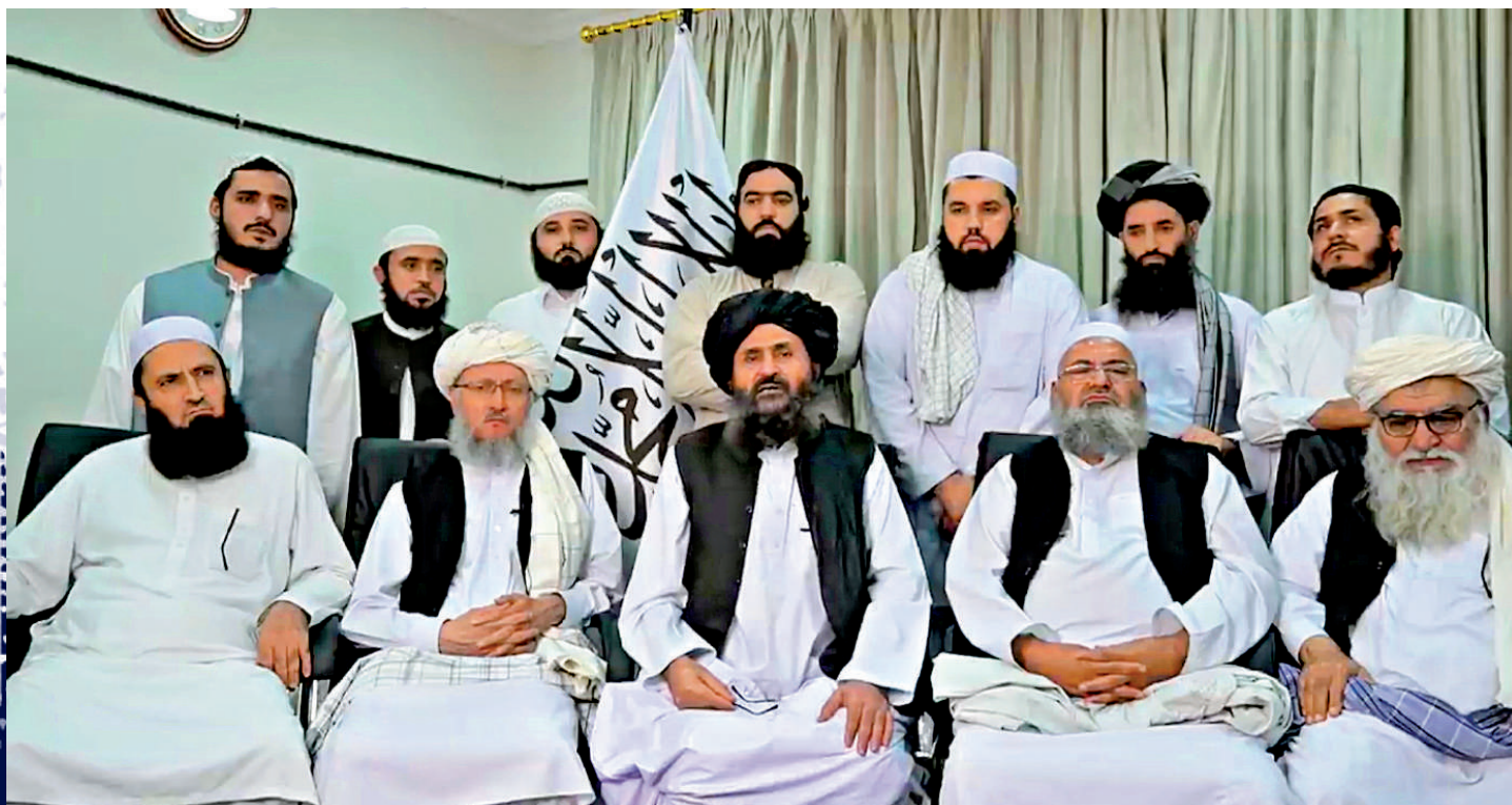
▲塔利班創始人之一巴拉達爾（前排中）將出任阿富汗新政府代理副總理。

塔利班發言人穆賈希德在當天的記者會上宣布，塔利班最高領導人阿洪扎達將以「埃米爾」的身份領導國家。目前科威特和卡塔爾兩個阿拉伯國家元首仍在這一稱號。穆罕默德·哈桑任代理總理，他在此前媒體的新政府高層的猜測中未有出現。