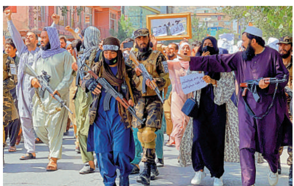
▲塔利班成員7日在喀布爾巴基斯坦大使館前巡邏。

海爾赫瓦獲釋後接觸活躍塔利班武裝分子，並作為塔利班官方代表團成員，於今年3月在俄羅斯與拜登的阿富汗特使哈利勒扎德談判。海爾赫瓦有份參與談判美國撤軍的最終條款，為塔利班重奪政權掃平障礙。