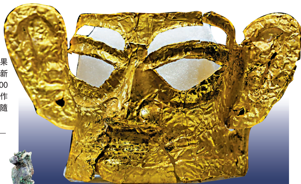
▲目前三星堆考古發掘中出土最完整的金面具。

此外，有着瓦片頭、酷似電視劇裏諸葛亮造型的立髮青銅人像，跨次元「穿越」為奧特曼的青銅小立人像，前所未見的帶有神樹紋的玉琮等文物，都展示了古蜀人天馬行空的想像力和藝術創造力。