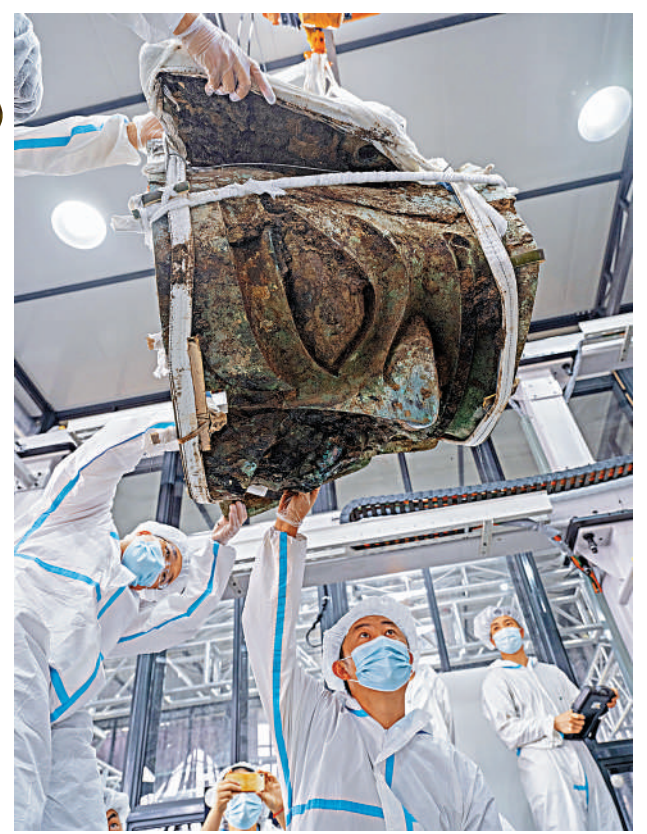
▲提取3號坑出土的青銅大面具。