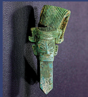
▲立髮青銅人像。