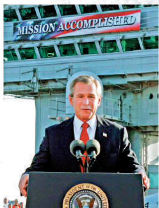
▲2003年5月2日，時任美國總統小布什在「林肯號」航母上宣布，結束在伊拉克的主要戰鬥。

具體來說，「9·11」後的美國中東政策有兩條主線：一是師承威爾遜學派的新保守主義學派。它將觀念性東西視為決定性因素，一定程度上承認「民主萬能論」，如「民主導致和平」，「民主導致繁榮」等等，並認為傳播這種觀念性東西是美國外交的頭等大事，由此得出結論：中東頻頻滋生反美恐怖活動，就是因為中東存在「民主赤字」，所以應該對伊斯蘭溫和國家進行「民主改造」。二是主要強調為了實現美國利益，可以使用強力達到目的的傑克遜學派。據此推演，既然恐怖主義是當前美國利益的最大威脅，因此有必要使用武力進行剷除。布什政府據此確立了「先發制人」的驕武戰略。