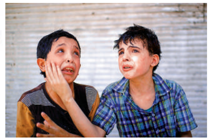
▲2017年6月，伊拉克摩蘇爾的一對小童哭訴，他們的房子在伊拉克軍隊與ISIS的戰鬥中被毀，家人被埋廢墟下。

伊拉克原本是中東地區屈指可數的富國和強國。美國佔領伊拉克後，所做的第一件事就是將伊拉克石油交易的貨幣換回美元。美國佔領當局還清除了伊拉克對資本嚴格限制的所有舉措：關稅被廢止；大量國企遭拍賣；經濟領域向外資開放；外國投資者可將所獲利益全部匯出；15%的固定稅被廢除。這為美