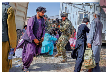
▲8月16日，把守喀布爾機場的美軍士兵用槍驅趕阿富汗人。

事實表明，美國為推行「大中東計劃」投入巨大，但卻未能使該地區更加繁榮穩定，反而攪動起各種長久積累的內部矛盾，使相關國家陷入教派紛爭、權力空轉等一系列新問題。