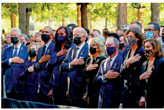
▲美國前總統克林頓夫婦（左一、二）、前總統奧巴馬夫婦（左三、四）、總統拜登夫婦（左五、六）等人11日在紐約「9·11」國家紀念館出席紀念儀式。

2019年布倫南司法中心的一份報告發現，政府對白人至上主義暴力襲擊的重視程度遠遠「不夠」，只是將其作為較輕的仇恨或幫派暴力罪行而不是恐怖主義來對待，缺乏緊迫性和嚴重性，案件也多從聯邦轉至州或地方執法部門。