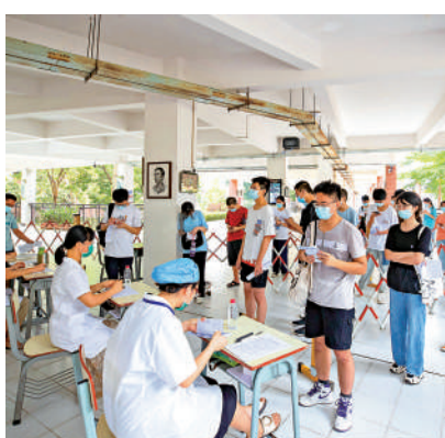
▲莆田市第五中學的學生在學校集中接種新冠疫苗。

【大公報訊】據中通社報道：北京時間11日下午，福建省莆田市政府新聞辦公室召開新聞發布會，通報疫情防控最新情況。截至11日16時，福建莆田此輪疫情累計報告24例核酸陽性，其中確診病例6