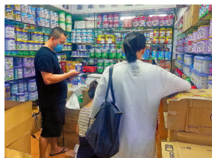
▲紫荊城港版奶粉受歡迎，有商家一天銷售過百罐。

【大公報訊】記者李昌鴻深圳報道：以往大量深圳市民會前往香港購買奶粉和朱古力，去年以來因為疫情隔離，他們無法前往香港，如今在深