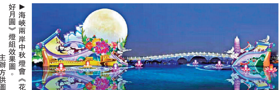
好月圓 海峽兩岸中秋燈會「花燈組」效果圖。

其中，周莊燈區以水鄉、古鎮、田園江南格局為依託，通過傳統綵燈、數字科技與現代光影創新應用，豐富夜間場景沉浸式體驗，扮靚「夜周莊」，重點打造水鄉古鎮、台灣老街、香村、祁莊三個主題片區，近百組燈組將點亮周莊唯美炫彩之夜。