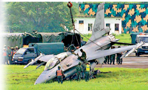
▲8月31日，台空軍一架F-16戰機在「漢光演習」預演時衝出跑道。

另一演訓重點科目是新成立的台海軍海鋒大隊機動二中隊驗證作戰效能。軍方表示，海鋒機動二中隊配備「雄風」三型、「雄風」二型反艦導彈的機動發射車組單位，將於演習中驗證作戰效能。