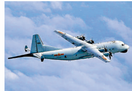
▲解放軍運-8反潛機同型機圖片。

態。對於解放軍在台海周邊的軍事行動，解放軍東部戰區新聞發言人張春暉此前表示，台灣及其附屬島嶼是中國領土神聖不可分割的一部分，中國軍隊戰備巡航完全正當合法，是針對當前台海安全形勢和維護國家主權需要採取的必要行動。