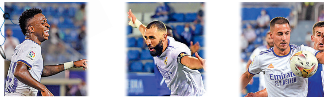
雲尼斯奧斯祖利亞（巴西）位置：左鋒 今季表現：4仗入4球 賓施馬（法國）位置：中鋒 今季表現：4仗入5球 夏薩特（比利時）位置：右鋒 今季表現：4仗入0球

皇馬在明晨的D組首戰就要造訪聖西路火併上屆意甲冠軍國際米蘭，今季在沙治奧拉莫斯與華拉尼兩大守將離隊下，皇馬顯得攻強守弱，後防有隱憂，國際米蘭射手拿達路馬天尼斯等人將有機可乘，可考慮「主客和」主勝。（NOW646台明晨3時直播）