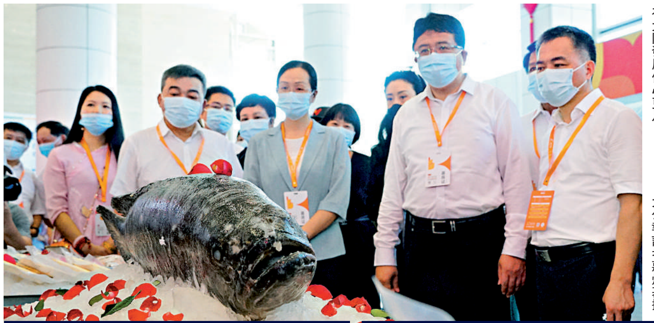
▲福建南安最近舉行兩岸農產品採購訂貨會。參會台農表示，大陸近年來持續推出惠台措施，讓台灣農民在大陸發展信心更足。

朱鳳蓮表示，事實充分證明，大陸始終是廣大台灣同胞、台資企業投資興業的最佳選擇。兩岸加強經貿合作，台灣經濟才能有更好發展，台灣同胞才能更多獲益受惠。民進黨當局一再干擾、阻礙兩岸經貿合作是不智的，也不行。