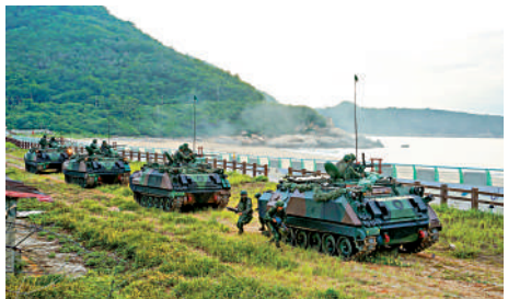
▲台軍15日在馬祖舉行演習。

【大公報訊】記者朱輝北京報導：針對民進黨當局在「漢光演習」中設想受到大陸方面「攻擊」，在高速公路上進行了機降訓練，國務院台辦發言人朱