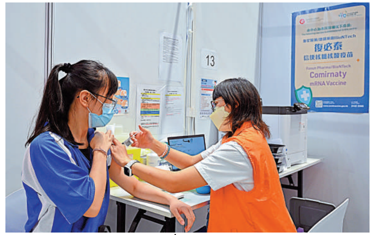
教育局截至昨日，共收到11所中學恢復全日面授課堂的申請。