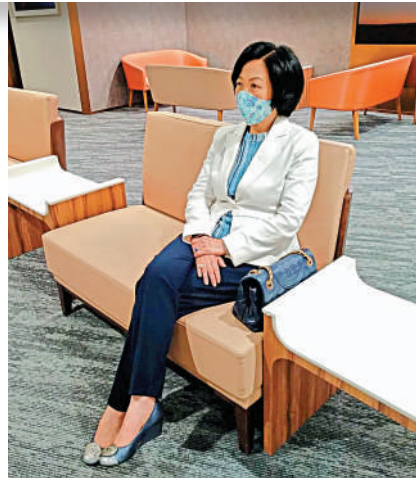
葉劉淑儀昨日到養和東區醫療中心接種第三針新冠疫苗，她選擇「溝針」接種復必泰。