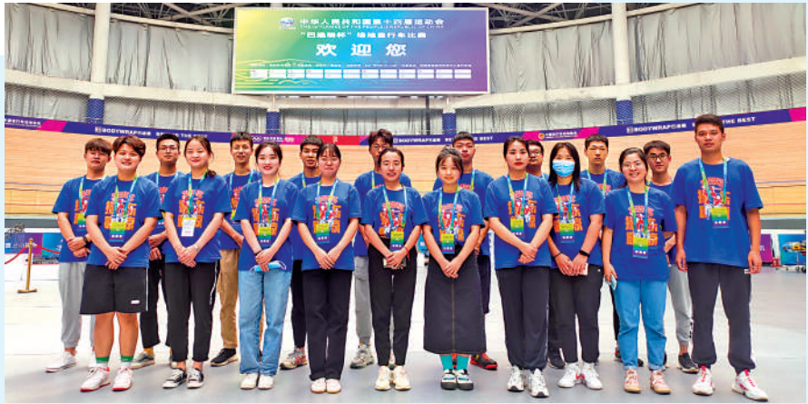
▲全運會場地單車賽的志願者。

河南隊吸收先進訓練方法 陳皓表示，港隊有許多優勢亦是值得內地借鑒與學習。陳皓說，港隊的隊員們雖不是「從小就開始訓練」，但他們對單車這項運動的熱愛，支撐他們能夠在有限的訓練時間中最大限度地發揮個人優勢，同時港隊亦有更多機會參加世界級的賽事。他認為，港隊與世界優秀選手切磋交流的機會更多，能更好地積累經驗，在訓練方法上也更能與世界先進訓練方法接軌。河南隊亦在此方面有意識地學習吸收世界先進的訓練方法，包括體能訓練、飲食安排等方面。 這也是為什麼近年來河南單車隊成績也不斷提升的原因。河南代表隊在此次比賽中亦取得了4金2銀3銅，是近16年來在全運上最好成績。