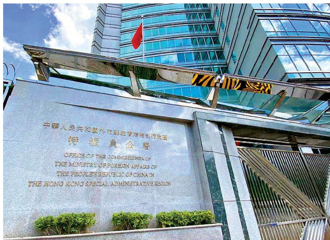
▲就個別美政客就香港特區政府依法確定七名區議員宣誓無效說三道四，大肆抹黑中央和特區政府，外交部駐港公署表示強烈不滿和堅決反對。

發言人重申，香港是中國的香港，香港事務純屬中國內政。我們堅定支持特區政府依法施政，嚴格落實「愛國者治港」原則，堅決把反中亂港分子排除在管治架構之外。外部勢力任何污蔑抹黑都阻擋不了中方堅決維護國家主權安全和發展利益的堅定決心，阻擋不了「一國兩制」行穩致遠的歷史進程，阻擋不了香港開啟由亂及治、由治及興嶄新篇章的鏗鏘步伐。