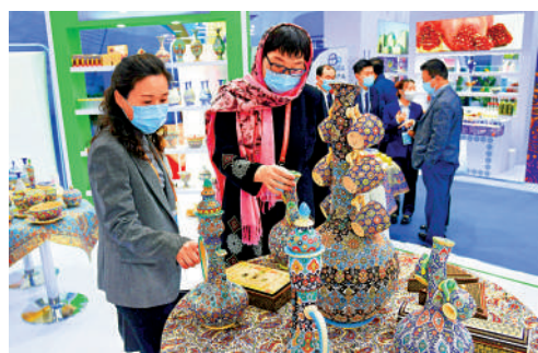
▲在今年上合博覽會暨地方經貿論壇上，觀眾在各國形象館展區參觀。資料圖片

氣、電力、化工、農業和民生項目建設。中國企業在上合組織成員國承包工程超過2900億美元。上合組織區域還是中歐班列的必經之路，今年前8個月，中歐班列開行