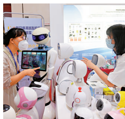
▲在南寧舉辦的中國—東盟博覽會上，參觀者（左）在了解機器人性能。

【大公報訊】據中新社報道：中國國務委員兼外長王毅17日在結束對越南、柬埔寨、新加坡、韓國訪問後，接受採訪時表示，此訪一個重要議題就是促推中國—東盟關係開創新局面，推動東亞地區成爲共同發展的示範區，而不是地緣博弈的競技場。