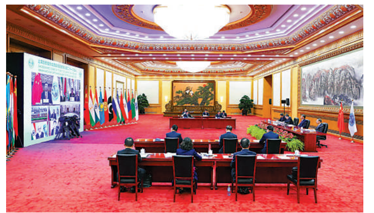
▲習近平在北京以視頻方式出席上海合作組織成員國元首理事會第二十一次會議時發表重要講話，倡議上合走安危共擔之路，深化禁毒、邊防、大型活動安保合作。