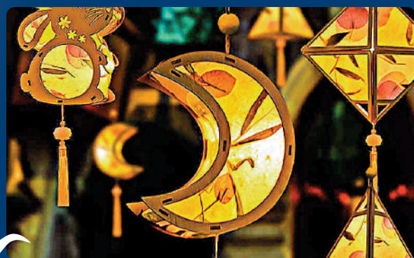
▲各式璀璨花燈為節日增色。