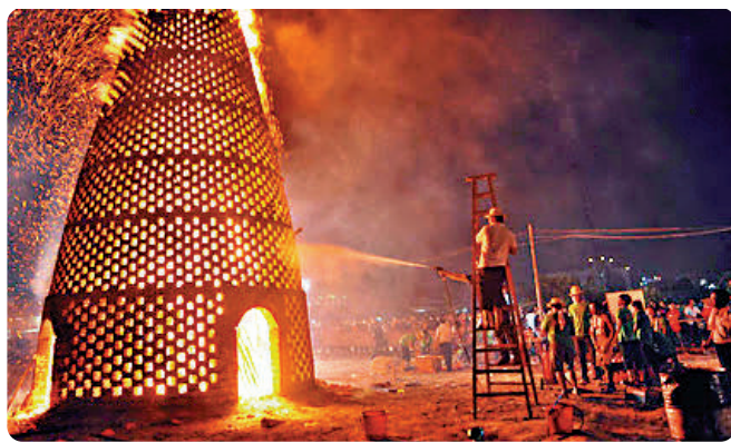
▲中秋節慶風俗「燒塔」，民眾燒旺柴枝祈願生活紅紅火火。