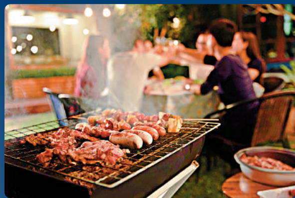
▲燒烤現已成為不少人度中秋的節目。