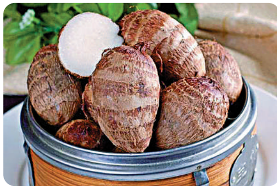
▲芋頭是傳統中秋食物之一。

關於中秋主題的國家級非遺中，「佛山秋色」亦是其中一項，這是在中秋節前後的月明之夜以大巡遊的形式舉行的活動，於明代已經出現，內容包含工藝展示和文藝表演，是民間藝術的綜合展示。在國家級非遺名錄上，香港的「大坑舞火龍」活動也佔一席位。