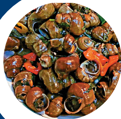
▲田螺寓意豐衣足食。