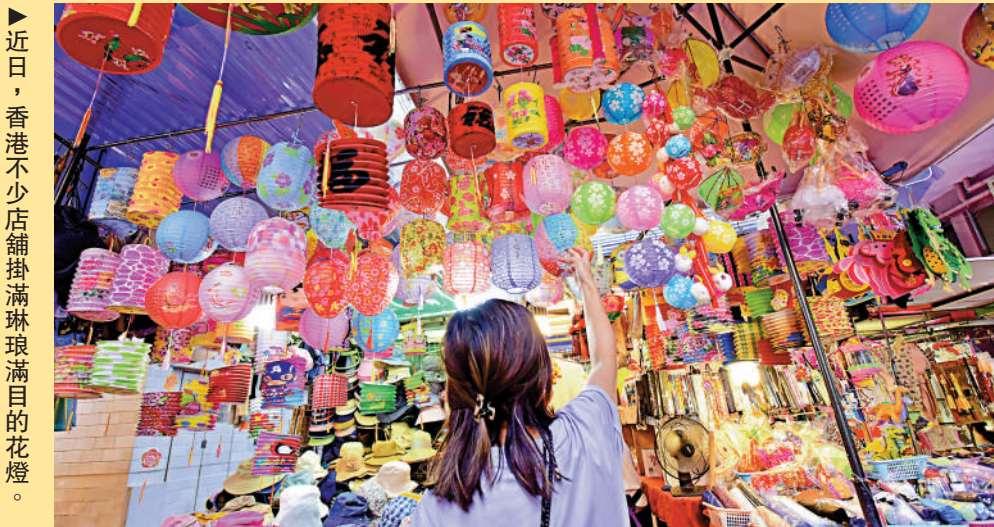
近日，香港不少店舖掛滿琳琅滿目的花燈。

對待傳統的節日，過節的方式也一直在變化，時至今日，新派與舊派並存。回溯中秋的起源，有許多的說法。中國是農業大國，古人對於氣象的精準把握體現在二十四節氣上，而中秋恰好在秋天的中間，正值農作物和各種果品陸續收成，是一家人齊聚慶祝豐收，表達喜悅的美好時間，漸漸地，中秋成為了重要的節日，在《詩·周頌·良耜序》中有云：「良耜，秋報社稷也。」有觀點認為，中秋節可能是古人「秋報」遺傳下來的習俗。時光流轉，今天我們怎樣度中秋，就來盤點一下。