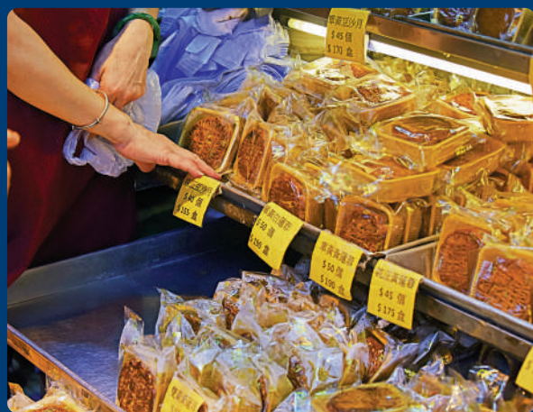
▲月餅為中秋必備食物。

自古以來，中秋節是屬於傳統的浪漫節日，活動繽紛多彩，多蘊藏着深厚的文化內涵。無論舊派還是新派的慶祝方式，重在親友的歡聚團圓。形式增加的是儀式感，將會成為未來偶然湧現的回憶。如蘇軾所寫，「但願人長久，千里共嬋娟」。