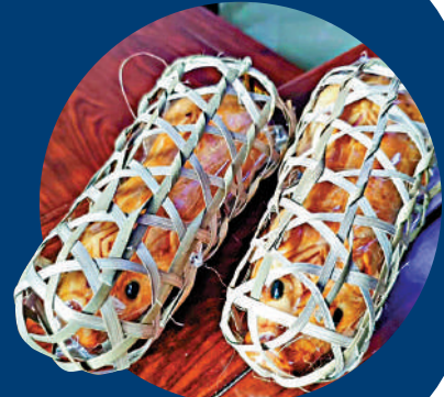
▲充滿懷舊氣息的豬仔餅。