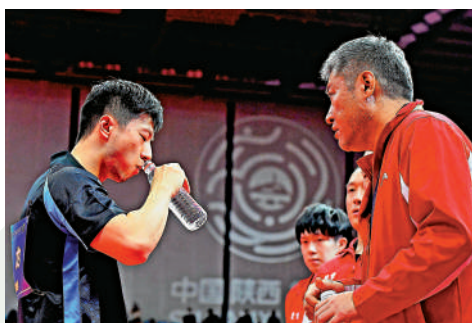
▲樊振東在男團賽事的男單比賽勇挫馬龍。 新華社 ▲馬龍（左）在比賽期間接受教練指導。 新華社