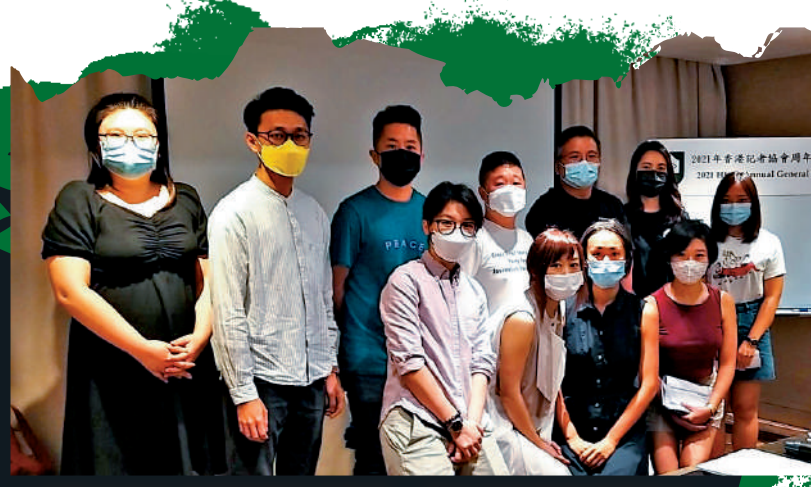
▲記協今年六月選出新年度執委，當中包括學生會員及公開會員等，其專業性存疑。

▶疑似財務往來資料發現經手人有「燕」字(紅圈)，翻查資料，記協於2009年至2013年的主席為麥燕庭。