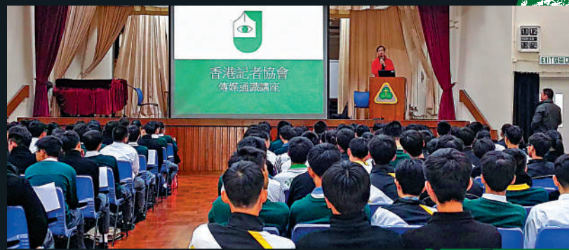
◀記協滲透校園，哄學生入會。