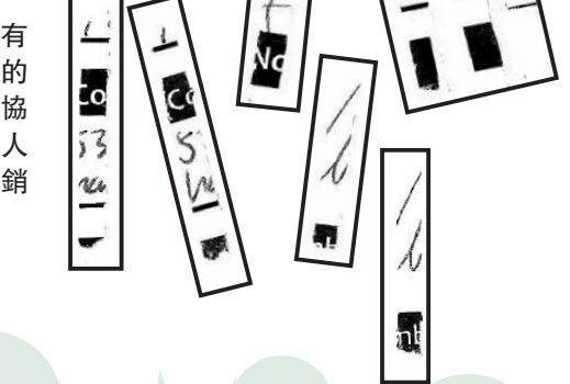
▶碎紙中有疑似會員的姓名等記協文件，令人懷疑記協銷毀證據。

外捐款？300多萬元的來源是個謎。保安局局長鄧炳強直言：「攤開數簿在陽光下曬曬吧，也許，主席(陳朗昇)你會發現，當中有很多連你自己都嚇一跳的賬目。」