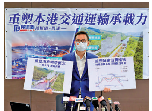
▲民建聯立法會議員陳恒鑽就「重塑本港交通運輸承載力」發表倡議書。

陳期望未來本港可以發展結合車輛、道路及交通燈三者，利用大數據去調度車流，解決現時「路路皆塞」、「一路多燈」等問題，做到真正的智慧出行。