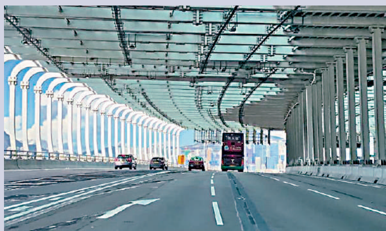
▲從中灣繞道駛至東區走廊匯合處，往北角需往左換線落橋，但地面實線被指過長難於換線，適逢昨日是假期，若在繁忙時段會經常出現塞車。 大公報突發組