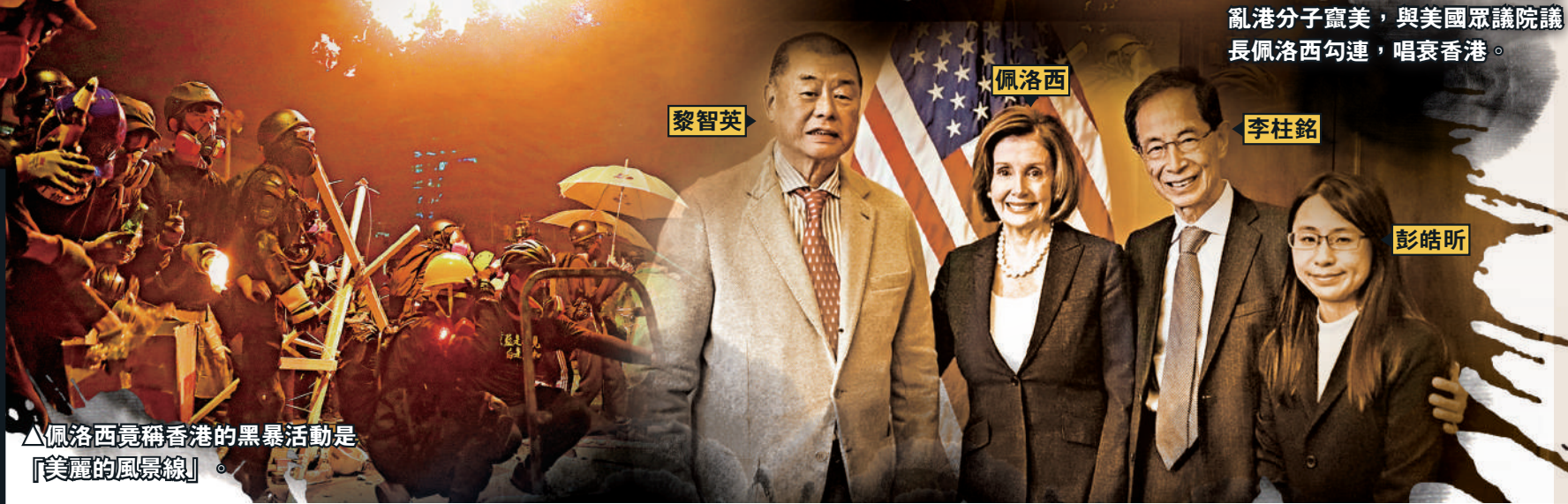
▼2019年時，黎智英及李柱銘等亂港分子竄美，與美國眾議院議長佩洛西勾連，唱衰香港。