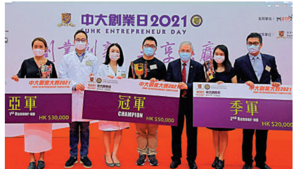
▲中大創業大賽冠亞季軍團隊與頒獎嘉賓合照。

「中大創業日2021」以線上及線下混合模式於中大校園舉行，透過網上創業展覽、主題講座、創業大師班、創業項目展示區等方式，展示中大師生校友的創業成果。其中，創業項目展示區為今年新增項目，主要展出四個中大創業者研發的先進科技產品。