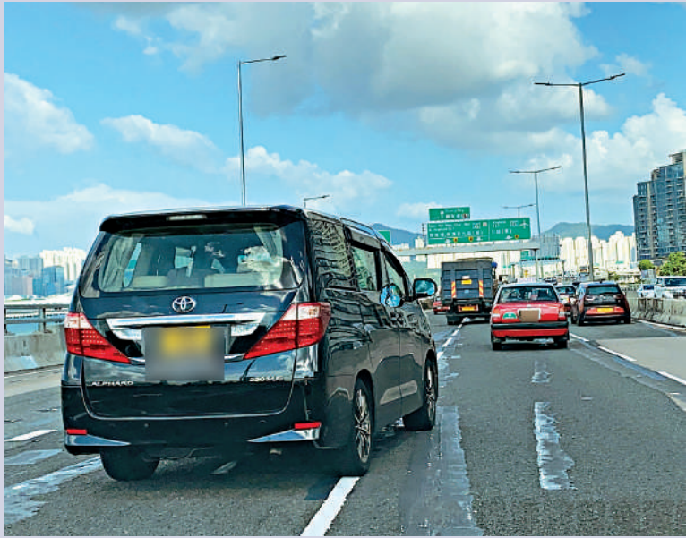
▲大公報記者再實地了解中灣繞道「死亡交叉位」，其間多次被切線車輛阻擋，出現爭路情況，過程險象環生。