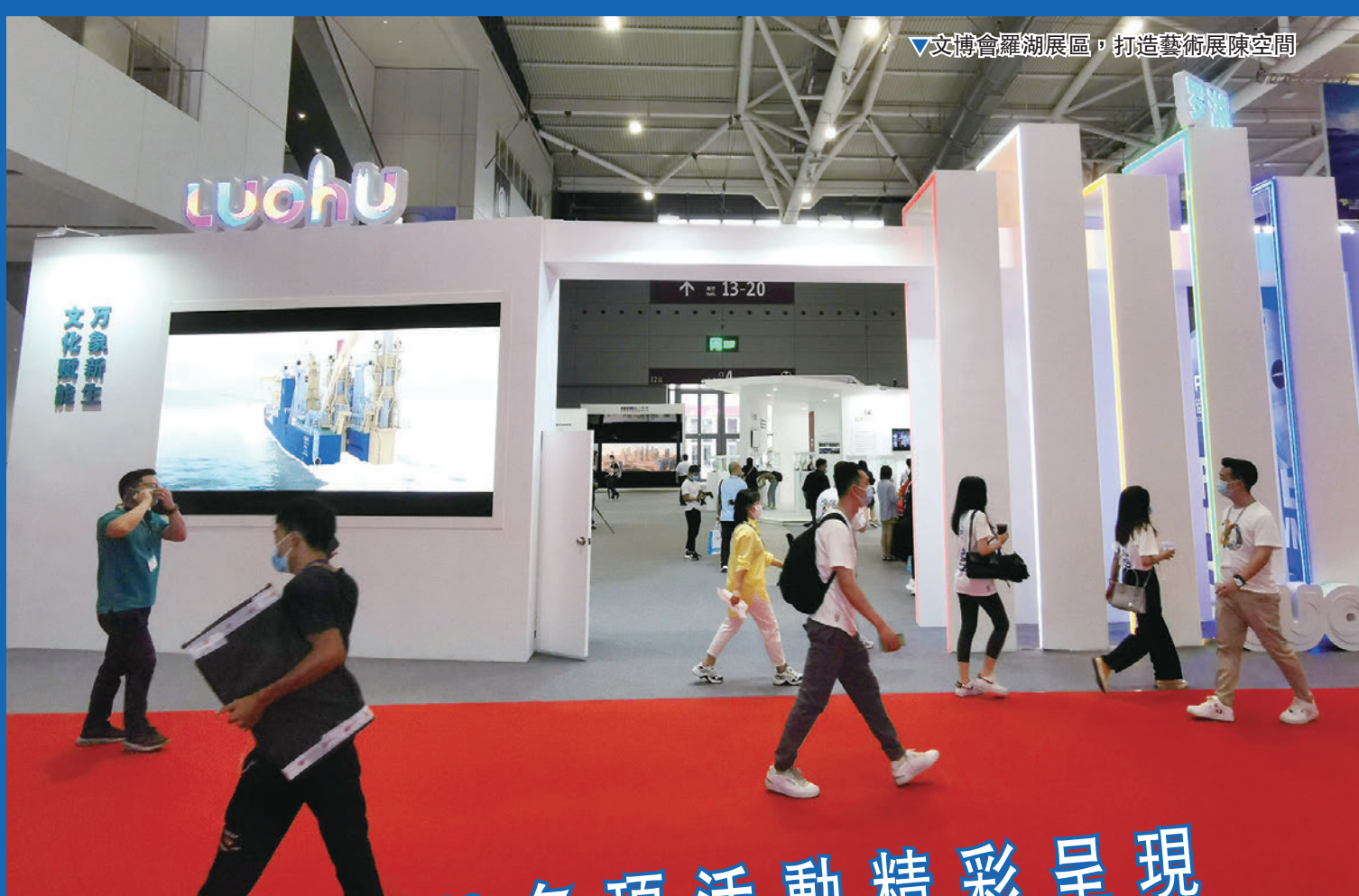
▼文博會羅湖展區，打造藝術展陳空間