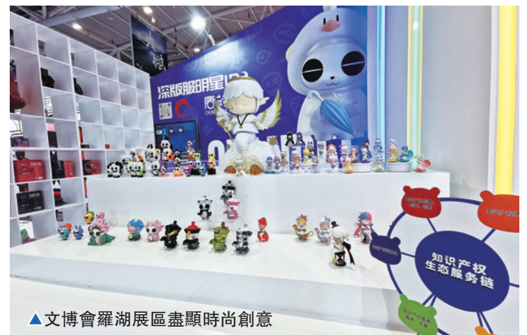
▲文博會羅湖展區盡顯時尚創意

未來，羅湖還將根據行業發展新趨勢，不斷調整完善文化產業扶持政策，全力推進中洲坊創意中心、國際藝術博覽交易總部、梧桐視效創意平台等重點項目建設，大力發展數字創意、藝術品拍賣等重點產業，打造都市味道濃厚、產業特色鮮明，獨具羅湖魅力的現代文化產業集群。