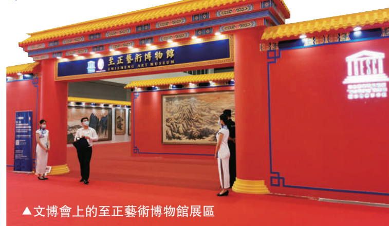
▲文博會上的至正藝術博物館展區

企業推出的藝術+金融的「至正模式」，在中國拍賣界和廣大藝術愛好者當中引起強烈反響。據悉，該集團旗下深圳至正國際拍賣有限公司從徵集、鑒定、評估、拍賣到銀行放貸，建立了一整套直接、安全、