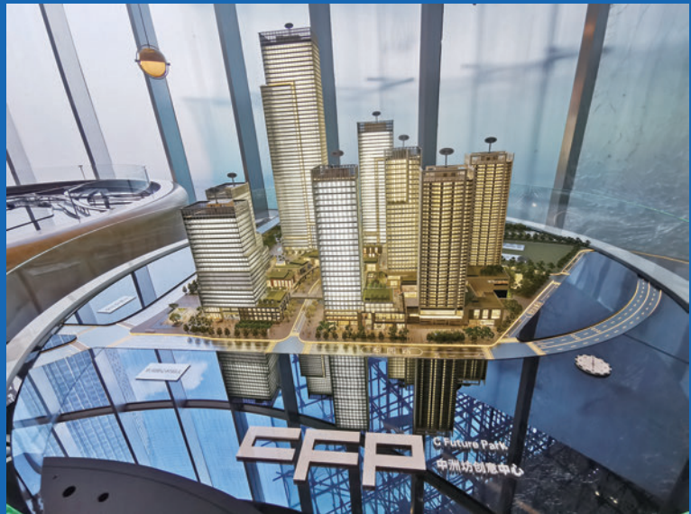
▲中洲坊創意中心效果圖

據悉，本屆文博會上，在主場館之外，羅湖還設6處分會場，分別為：藝展中心、寶能·第一空間、珠寶集聚區、古玩城、國家動漫產業基地和梧桐山宏博昌榮傳媒文化谷等分會場，各分會場根據自身產業特點，策劃舉辦超過40多項活動。