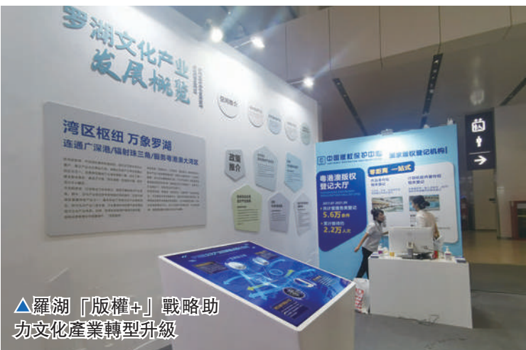
▲羅湖「版權+」戰略助力文化產業轉型升級