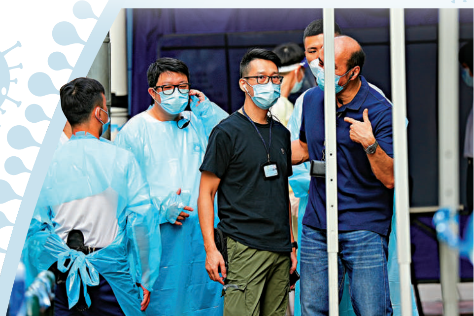
▲澳門新增兩宗確診個案，昨日下午至周二下午，在為期三日的全民檢測。圖為澳門防疫人員在確診者居住大廈附近工作。