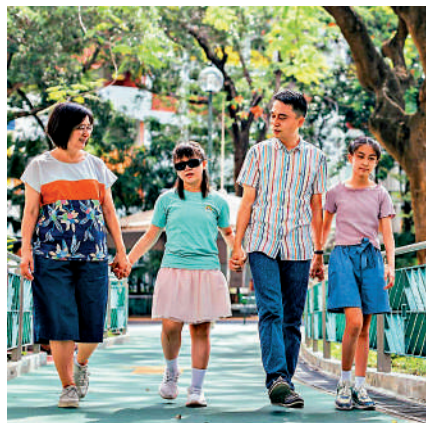
早點介入，力求避免惡化。」

「當初未做基因測序前，感到茫無頭緒，好像在海裏漂浮瞎撞。」朱先生形容Alstrom氏症候群是與時間競賽的疾病，有朋友錯過關鍵治療期，脊柱側彎壓迫內臟，「測序確診後可